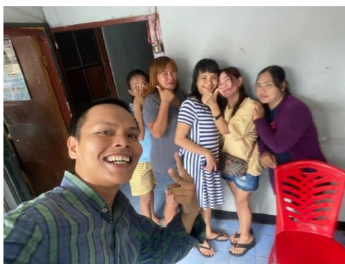
Gambar 2. Foto bersama para wanita pekerja seks komersial

Goffman membagi panggung depan ini menjadi dua bagian: front pribadi ( personal front ) dan setting front pribadi terdiri dari alat-alat yang dianggap khalayak sebagai perlengkapan yang dibawa aktor ke dalam setting, misalnya dokter diharapkan mengenakan jas dokter dengan stetoskop menggantung di lehernya (Johnson:1986:45). Personal front mencakup bahasa verbal dan bahasa tubuh sang aktor. Misalnya, berbicara sopan, pengucapan istilah-istilah asing, intonasi, postur tubuh, ekspresi wajah, pakaian, penampilan usia dan sebagainya. Ciri yang relatif tetap seperti ciri fisik, termasuk ras dan usia biasanya sulit disembunyikan atau diubah, namun aktor sering memanipulasinya dengan menekankan atau melembutkannya, misalnya menghitamkan kembali rambut yang berubah dengan cat rambut.