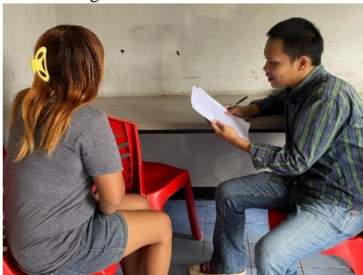
Gambar 1. Wawancara informan L

Dalam penelitian ini ingin melihat bagaimana panggung depan serta panggung belakang Pekerja Seks Komersial agar terdapat gambaran terkait perilaku para wanita pekerja seks komersial. Penelitian ini menggunakan prespektif Dramaturgi dan metode penelitian kualitatif dengan metode pengumpulan data melalui wawancara mendalam dengan observasi.