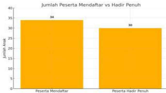
Gambar 1. Diagram Persentase Kehadiran Peserta

Kegiatan pelatihan dirancang dengan metode yang menyenangkan dan tidak membosankan, seperti permainan pembuka, cerita inspiratif, serta praktik langsung yang dikemas dalam suasana edukatif. Anak-anak terlihat sangat antusias saat diminta mempresentasikan hasil karya mereka di depan kelompok kecil. Fasilitator mencatat bahwa beberapa anak yang awalnya pendiam menjadi lebih aktif dan percaya diri setelah mengikuti dua sesi pelatihan. Bahkan, beberapa orang tua secara informal menyampaikan bahwa anak mereka jarang terlihat sepenuh semangat itu saat belajar di rumah atau sekolah. Hal ini memperkuat temuan dari Pratiwi & Gunawan (2019), bahwa kegiatan seni yang dilakukan dalam suasana komunitas dapat memicu partisipasi lebih besar daripada kegiatan belajar konvensional.