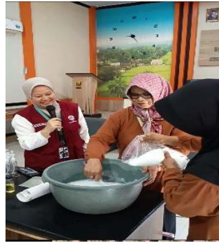
Gambar 1. Pembuatan Sabun