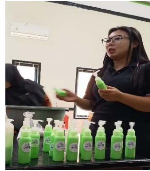
Gambar 2. Hasil produk pembuatan sabun

Kelompok KKN Institut Madani Nusantra sukses memproduksi sabun cuci piring cair dalam kemasan botol 100 ml sebagai wujud dari program pemberdayaan masyarakat. Produk ini dibuat dengan formula yang mudah diperoleh dan mudah dipraktikkan oleh Masyarakat Desa Karangjaya karena pembelian bahan produksi dan juga alat pengemasan bisa di beli melalui e-commerce sebagai bentuk salah satu pemanfaatan digital (Maulana, D. (2023)