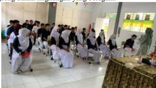
Gambar 4. Pengenalan Nilai-Nilai Kebhinekaan sebagai Fondasi Karakter.

dimaksudkan untuk menciptakan siswa yang tidak hanya tahu tentang perbedaan, tetapi juga tahu cara menghargai dan merayakannya. Selama kegiatan, siswa juga didorong untuk berpartisipasi dalam proyek- proyek kolaboratif yang melibatkan berbagai jurusan di sekolah, dengan tujuan membangun keterampilan sosial yang berbasis pada nilai-nilai kebhinekaan. Salah satu bentuk kegiatan yang diterapkan adalah proyek berbasis seni, di mana siswa dari berbagai latar belakang budaya bekerja sama untuk menghasilkan karya seni yang mencerminkan keberagaman budaya Indonesia. Kegiatan ini sejalan dengan pendapat (Wantu dkk 2025) yang menekankan bahwa pendidikan karakter berbasis kebhinekaan tidak hanya mengajarkan teori tetapi juga mendorong praktik nyata, di mana siswa belajar melalui pengalaman langsung dalam lingkungan yang beragam.