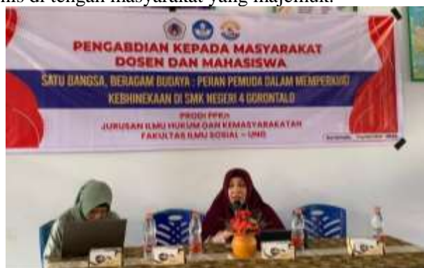
Gambar 2. Pengenalan Nilai-Nilai Kebhinekaan dalam Jiwa Pemuda di SMK Negeri 4 Gorontalo

Sementara itu, aspek kedua lebih menekankan pada implementasi nyata nilai-nilai kebhinekaan dalam keseharian siswa. Penerapannya dilakukan melalui kegiatan pembelajaran kolaboratif lintas jurusan, aktivitas ekstrakurikuler, serta simulasi peran sosial yang dirancang untuk menumbuhkan empati, kepedulian, dan keterampilan kerja sama antar siswa. Melalui kegiatan ini, kebhinekaan diposisikan bukan sekadar wacana, melainkan pengalaman langsung yang memperkuat karakter dan jati diri peserta didik. Dengan demikian, program pengabdian ini tidak hanya mengembangkan kecerdasan intelektual, tetapi juga menumbuhkan karakter pemuda yang berakhlak, menjunjung tinggi persatuan, dan mampu hidup harmonis di tengah masyarakat yang majemuk.