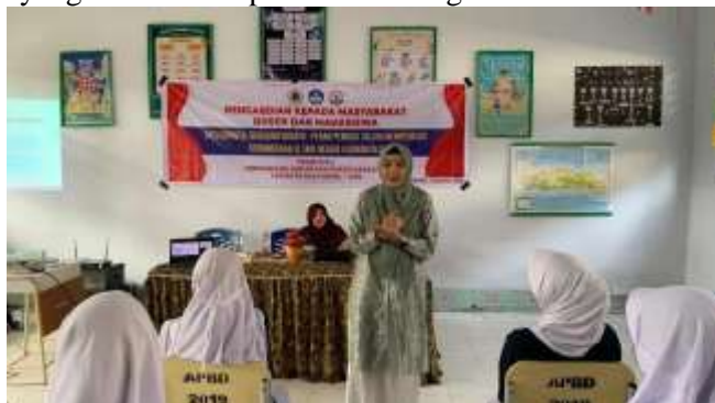
Gambar 3. Pengenalan Nilai-Nilai Kebhinekaan sebagai Fondasi Karakter Di SMKN 4 Gorontalo

Hasil dari kegiatan ini menunjukkan adanya peningkatan kesadaran siswa dalam menginternalisasi nilai-nilai kebhinekaan, yang tercermin dalam sikap mereka yang lebih terbuka, saling menghargai perbedaan, dan menunjukkan komitmen untuk menjaga persatuan di lingkungan sekolah dan masyarakat. Hal ini sesuai dengan temuan (Wantu dkk 2025), yang menyatakan bahwa penguatan kebhinekaan dalam pendidikan karakter dapat meningkatkan rasa persatuan di antara siswa yang berasal dari berbagai latar belakang sosial dan budaya. Proses pengenalan ini berperan penting dalam membentuk karakter pemuda yang tidak hanya cerdas secara akademik, tetapi juga berintegritas, toleran, dan memiliki komitmen yang kuat terhadap keutuhan bangsa Indonesia.