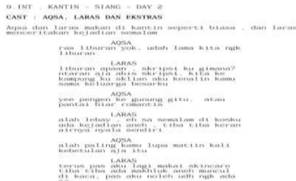
Gambar 2. Screenshot Skenario Film TRAH

Pada Scene 9 menggunakan struktur tiga babak masih berada dalam Babak II ( Confrontasi ), di mana konflik mulai meningkat. Laras menceritakan kejadian-kejadian aneh yang dialaminya kepada Aqa, namun keduanya menyepakati bahwa itu hanya efek kelelahan. Struktur ini berfungsi untuk mempertahankan ilusi normalitas.