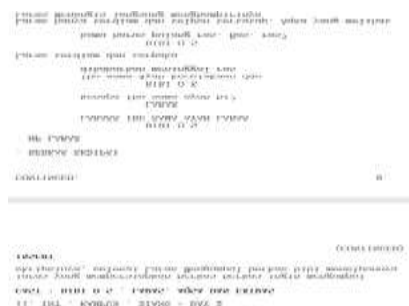
Gambar 3. Screenshot Skenario Film TRAH

Pada Scene 11 menggunakan struktur tiga babak juga termasuk dalam Babak II (Konfrontasi), di mana penonton mulai mendapat informasi yang salah secara eksplisit. Kabar kematian orang tua Laras diberikan oleh Bibi dan diterima tanpa pertanyaan, pengkarya ingin membuat penonton bertanya.