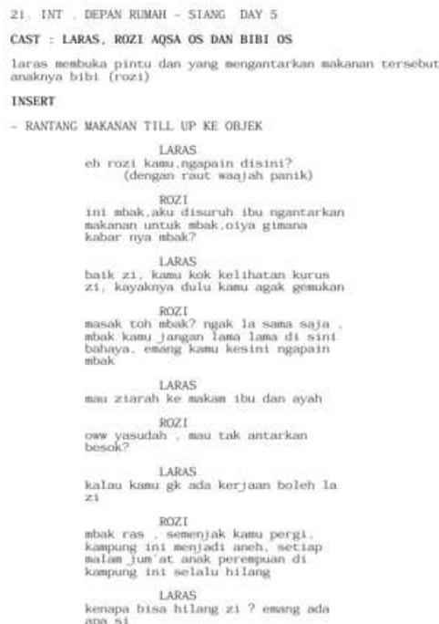
Gambar 5. Screenshot Scene 21 Film TRAH

Pada Scene 21 menggunakan struktur tiga babak memasuki Babak III (Resolusi Awal). Laras masih mempercayai Bibi padahal mencurigakan meskipun Rozi memberi petunjuk, Laras tetap mengikuti arahan Bibi.