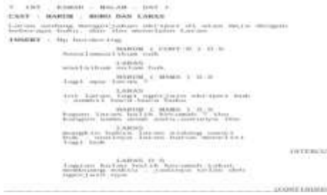
Gambar I.1 Screenshot Skenario Film Trah

Pada Scene 7 menggunakan struktur tiga babak menggunakan struktur tiga babak sebagai bagian dari Babak I (Setup). Pada babak ini, penonton diperkenalkan pada dunia tokoh utama, Laras, yang sedang menjalani kehidupan kampus secara normal. Peristiwa-peristiwa aneh seperti suara keran menyala sendiri dan sosok di cermin dianggap biasa oleh Laras. Ia juga mendapat telepon.