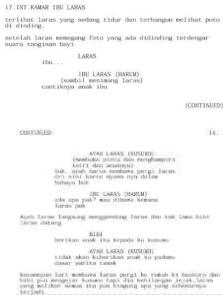
Gambar 4. Screenshot Skenario Film TRAH

Pada Scene 17 menggunakan struktur tiga babak masuk dalam Babak II dan menjelang akhir menuju Babak III. Ingatan masa kecil Laras yang muncul melalui mimpi adalah flashback penting yang terlambat, dengan dikemas menjadi satu pengambilan ( POV Laras ).