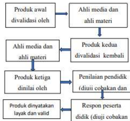
Gambar 2. Tahapan Pengembangan e-LKPD

dibuat dapat digunakan sebagai sumber belajar oleh peserta didik. Uji coba yang dilakukan berupa uji coba kelompok kecil yaitu peserta didik kelas X Fase E 5 SMA Negeri 3 Kota Jambi. Berikut tahapan pengembangan produk yang dapat dilihat pada gambar berikut.