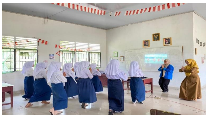
Gerak Sembah dan Saya diajak Guru Memperagakan (Dokumentasi : Tira, 2025)

https://youtu.be/XVUvnrbCEGg?si=rNEahEU9JvmM5BiH