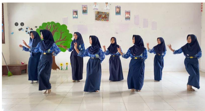
Guru Melakukan Evaluasi Kepada Siswa