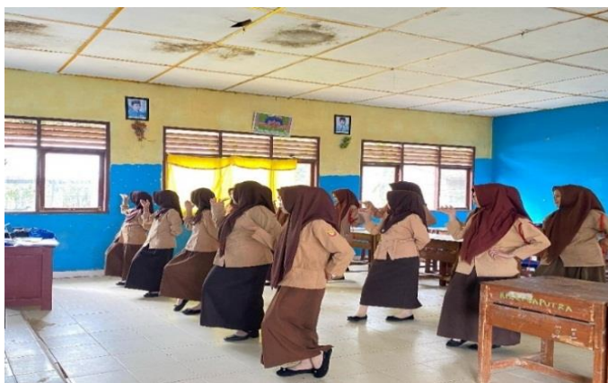
Gerakan Jumputan Ukel Kiri Tari Silampari Kayangan Tinggi (Dokumentasi : Pera, 2025)

https://youtu.be/XVUvnrbCEGg?si=rNEahEU9JvmM5BiH