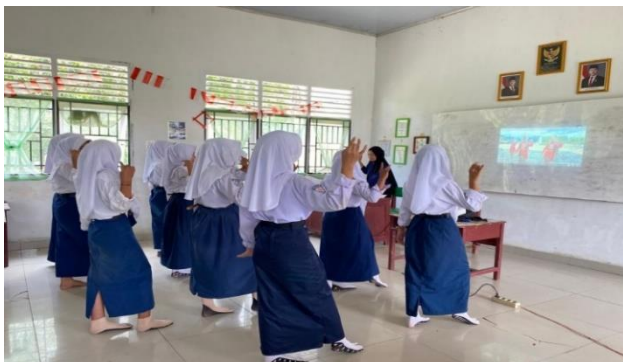
Gerak Meliuk Tari Silampari Kayangan Tinggi