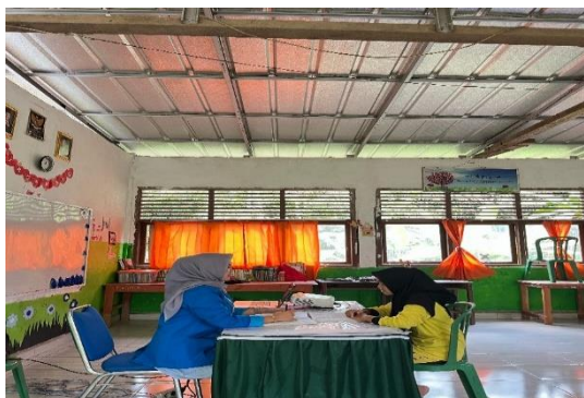
Gambar 3. Wawancara dengan Andina siswa kelas VIII