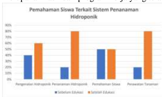
Gambar 1. Ilustrasi hasil edukasi yang ditampilkan dalam bentuk gambar grafik.

Beberapa ilustrasi ini merupakan hasil dari program kerja yang telah dijalankan.