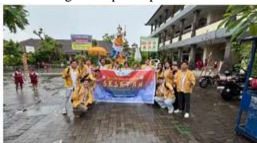
Gambar 2. Foto bersama saat program kerja telah terlaksana.

Gambar 1 adalah ilustrasi grafik yang merupakan hasil dari edukasi yang telah dilaksanakan di SDN 6 Sesetan. Dalam grafik tersebut terdapat batang berwarna biru yang menunjukkan presentase sebelum edukasi dan batang berwarna orange merupakan presentase setelah edukasi.