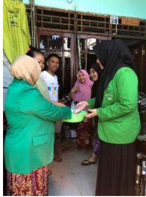
Gambar 1. Menjelaskan tentang Zakat fitrah