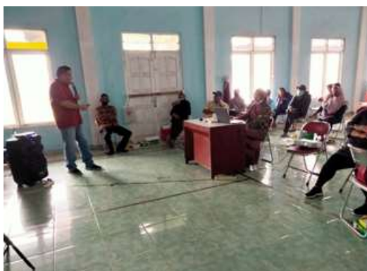
Gambar 1 Penyampaian materi oleh pemateri

Hasil dari pengabdian ini dapat dilihat pada Gambar 1. Pada kegiatan ini dapat dilihat bahwa minat dan semangat para peserta dalam mengikuti pengabdian sangat besar sekali, sehingga mempermudah dalam proses belajar mengajar dan pemberian motivasi, menyediakan tempat dan fasilitas yang memadai meskipun dalam kondisi yang sederhana. Selama sesi pelatihan, peserta diberikan materi mengenai manfaat penggunaan QRIS sebagai alat transaksi nontunai serta praktik instalasi dan penggunaan QRIS melalui mitra penyedia layanan pembayaran digital. Peserta juga dikenalkan dengan beberapa aplikasi pencatatan keuangan digital seperti BukuKas dan Catatan Keuangan Harian. Pelatihan dilakukan secara interaktif, dengan metode simulasi dan studi kasus sederhana untuk membantu peserta memahami fungsi dan penerapan aplikasi dalam kehidupan usaha sehari-hari. pelatihan yang tepat, UMKM mampu mengelola keuangan usaha lebih transparan dan akurat, sehingga mendukung pengambilan keputusan bisnis yang lebih baik di masa pasca pandemi (Farhan & Shifa, 2023).