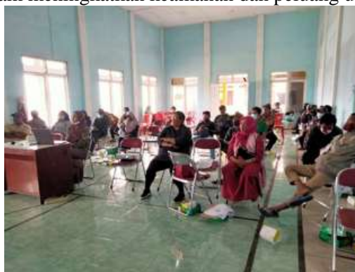
Gambar 2 Peserta PKM

Demikian juga pada kegiatan diskusi atau tanya jawab, dapat dilihat pada Gambar 2. Peserta Pengabdian Masyarakat ini mempunyai antusias tinggi untuk menggali informasi tentang keterampilan untuk memulai pembayaran menggunakan digital yaitu QRIS dan melakukan pembukuan keuangan secara digital, ditunjukkan dengan jumlah peserta yang hadir 35 orang dan 90% peserta mengajukan pertanyaan serta 100% peserta dapat menerapkan menjadi pemimpin yang baik dalam organisasi. Setelah melakukan diskusi terkait dengan kepemimpinan, peserta diberikan kasus untuk dipecahkan kemudian dibahas bersama dengan pemateri, seperti pada Gambar 2. Pelatihan berhasil mengubah persepsi pelaku UMKM yang awalnya skeptis terhadap pembayaran digital menjadi lebih terbuka dan menyadari manfaat QRIS dalam meningkatkan keamanan dan peluang usaha (Mege et al., 2023).