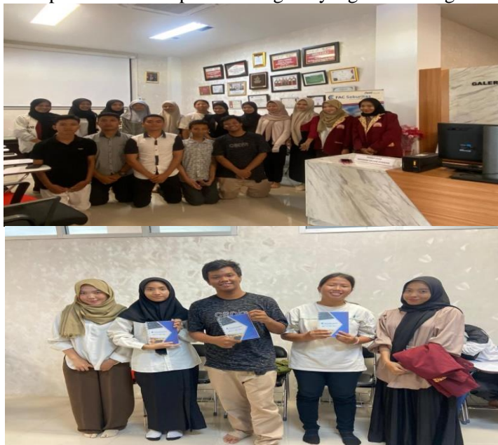
Gambar 3. Studi Lapangan Ke GIS UIN Fatmawati Sukarno Bengkulu

Pada saat kegiatan studi lapangan di GIS UIN Fatmawati penulis bekerja sama dengan anggota KSPM GIS UIN Fatmawati Sukarno Bengkulu memberikan lomba sederhana untuk mengasah daya ingat pada sektor pasar modal dengan melakukan game stocklab dimana penulis memberikan reward sederhana untuk 3 orang dengan koin terbanyak. Penulis harap dengan kegiatan sederhana ini dapat meningkatkan minat siswa siswi tersebut untuk terus berinvestasi dan juga dapat menerapkan GIE BEI yang baik untuk kedepannya karna dengan itu juga akan dapat meningkatkan minat belajar siswa-siswi lain mengenai investasi di pasar modal tanpa ada keraguan yang lain. Sebagaimana berikut :