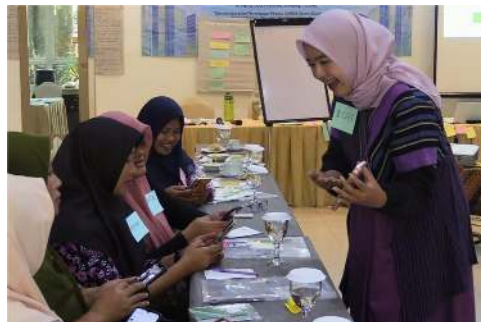
Gambar 1. Suasana pelatihan literasi keuangan pelaku UMKM