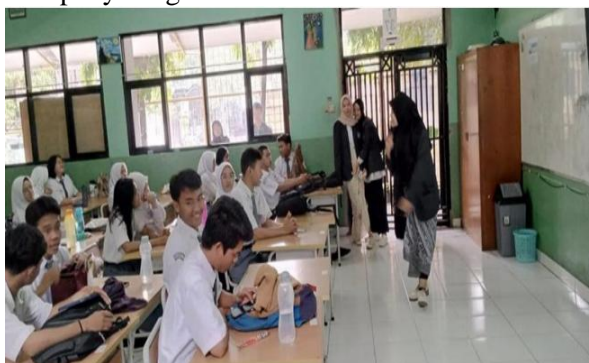
Gambar 1. Kegiatan seminar

Selama diskusi berlangsung, siswa aktif mengajukan pertanyaan dan memberikan pendapat mereka. Siswa diajari tentang pengertian media sosial, bahaya hoaks, pentingnya privasi online, dan etika dalam berinteraksi di internet. Mereka juga melakukan simulasi penggunaan media sosial yang produktif dan sehat. Untuk membantu siswa memahami ancaman dunia digital secara nyata, pemateri memberikan contoh nyata dari penyalahgunaan media sosial.