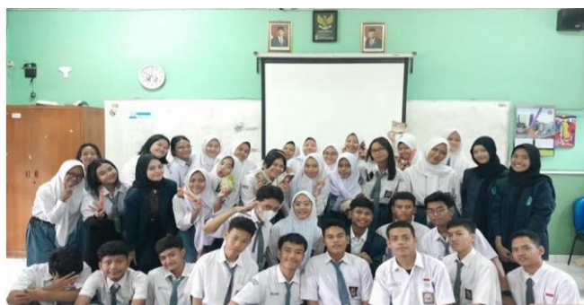
Gambar 2. Bersama siswa/i SMAN 80 Jakarta

Sebanyak 80% peserta mampu menyebutkan tiga atau lebih cara menggunakan media sosial dengan aman. Hal ini menunjukkan bahwa pelatihan berhasil meningkatkan kesadaran peserta tentang pentingnya keamanan dalam berinteraksi di dunia maya. Peserta memahami bahwa penggunaan media sosial yang aman meliputi pengaturan privasi, pemilihan informasi yang dibagikan, dan kewaspadaan terhadap interaksi dengan orang asing.