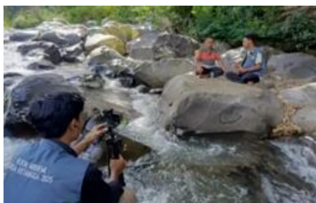
Gambar 11. Pembuatan Video di Bekas Telapak Kaki Kuda Raja