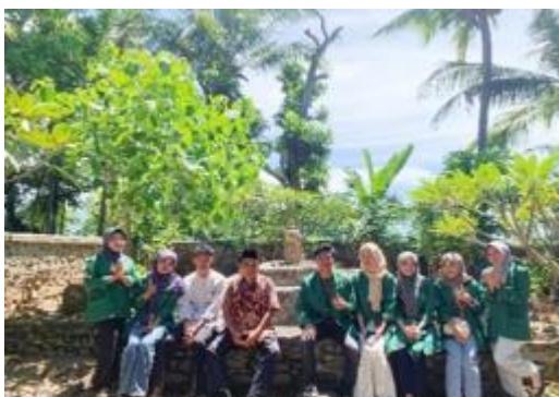
Gambar 6. Survey Lokasi di Bekas Telapak Kaki Kuda