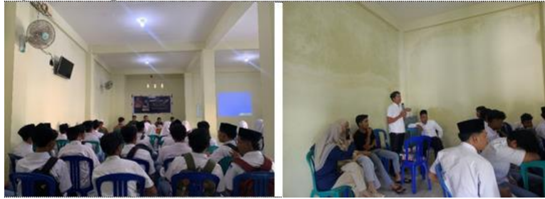
Gambar 15. Kegiatan Seminar Aset Budaya dan Sejarah Desa Ketangga

Tahap selanjutnya adalah napak tilas sejarah, sebuah penelusuran langsung ke situs-situs budaya dan sejarah yang telah diperkenalkan sebelumnya. Rute napak tilas dimulai dari Masjid Kuno Pusaka sebagai titik awal perjalanan. Di lokasi ini, tim pengabdian telah menyiapkan papan informasi sejarah serta peta petunjuk arah menuju titik-titik napak tilas berikutnya. Papan informasi tersebut memberikan gambaran umum sejarah masjid serta peranannya dalam penyebaran Islam di masa Kerajaan Selaparang. Peserta kemudian bergerak mengikuti rute yang telah disusun, mengunjungi titik-titik penting dan mendapatkan penjelasan langsung dari tim pengabdian mengenai nilai historis dan budaya dari masing-masing lokasi. Setiap lokasi pemberhentian menjadi momen edukatif sekaligus reflektif yang memperkuat hubungan peserta dengan warisan leluhur mereka. Setelah seluruh rangkaian selesai, peserta kembali mengikuti post-test untuk mengevaluasi peningkatan pemahaman setelah mengikuti seminar dan napak tilas.