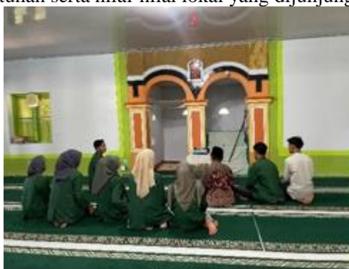
Gambar 1. Survey Lokasi di Masjid Pusaka

Pada tahap persiapan, langkah pertama yang dilakukan adalah survei lokasi untuk menggali potensi sejarah dan budaya yang dimiliki oleh desa ketangga. Selanjutnya, dilakukan komunikasi dan koordinasi dengan pihak desa serta tokoh masyarakat setempat guna memperoleh dukungan dan arahan terkait pelaksanaan program. Komunikasi ini bertujuan untuk memastikan bahwa kegiatan yang dirancang sesuai dengan kebutuhan serta nilai-nilai lokal yang dijunjung masyarakat.