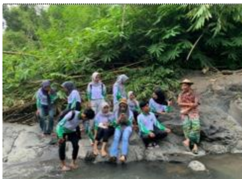
Gambar 5. Survey Lokasi di Makam Prabu Rangka Sari