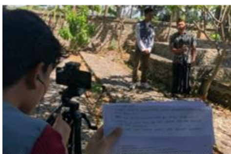
Gambar 12. Pembuatan Video di Makam Mamiq Raja