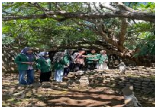
Gambar 4. Survey Lokasi di Makam Mamiq Raja