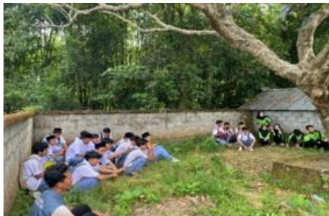
Gambar 20. Napak Tilas Makam Prabu Rongkasari