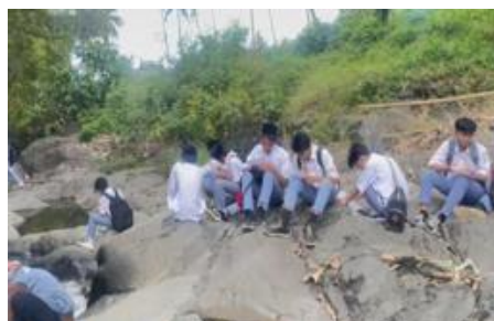
Gambar 18. Napak Tilas di Makam Surya Lebe