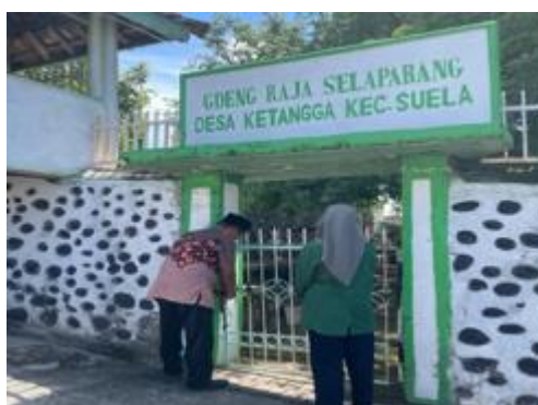
Gambar 2. Survey Lokasi di Gedeng Raja