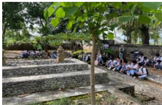
Gambar 21. Napak Tilas di Makam Mamiq Raja