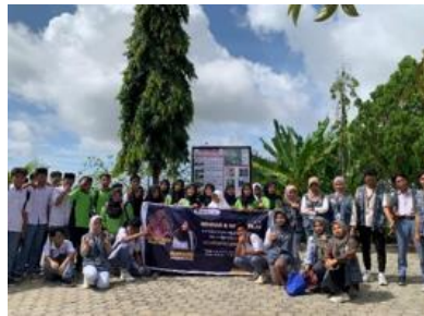
Gambar 16. Napak Tilas di Masjid Pusaka

Tahap selanjutnya adalah napak tilas sejarah, sebuah penelusuran langsung ke situs-situs budaya dan sejarah yang telah diperkenalkan sebelumnya. Rute napak tilas dimulai dari Masjid Kuno Pusaka sebagai titik awal perjalanan. Di lokasi ini, tim pengabdian telah menyiapkan papan informasi sejarah serta peta petunjuk arah menuju titik-titik napak tilas berikutnya. Papan informasi tersebut memberikan gambaran umum sejarah masjid serta peranannya dalam penyebaran Islam di masa Kerajaan Selaparang. Peserta kemudian bergerak mengikuti rute yang telah disusun, mengunjungi titik-titik penting dan mendapatkan penjelasan langsung dari tim pengabdian mengenai nilai historis dan budaya dari masing-masing lokasi. Setiap lokasi pemberhentian menjadi momen edukatif sekaligus reflektif yang memperkuat hubungan peserta dengan warisan leluhur mereka. Setelah seluruh rangkaian selesai, peserta kembali mengikuti post-test untuk mengevaluasi peningkatan pemahaman setelah mengikuti seminar dan napak tilas.