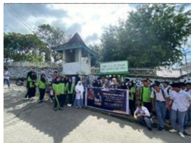
Gambar 17. Napak Tilas di Gedeng Raja