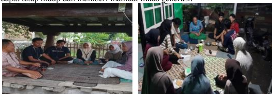
Gambar 7. Diskusi Bersama Ketua BPD dan Karang Taruna