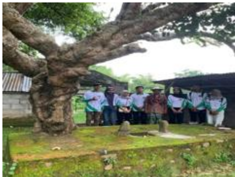
Gambar 3. Survey Lokasi di Makam Surya Lebe