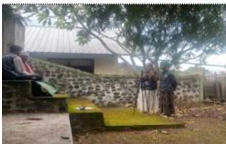
Gambar 9. Pembuatan Video di Gedeng Raja Selaparang