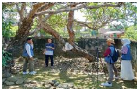
Gambar 10. Pembuatan Video di Makam Surya Lebe