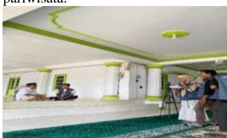
Gambar 8. Pembuatan Video di Masjid Pusaka