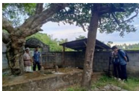
Gambar 13. Pembuatan Video di Makam Prabu Rangkasari