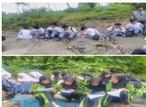
Gambar 23. Siswa-siswi menjawab instrumen pertanyaan (post-test)