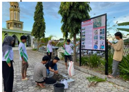
Gambar 14. Pemasangan Papan Informasi Situs-situs Bersejarah di Desa Ketangga