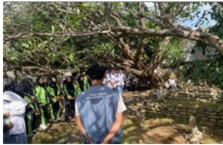
Gambar 19. Napak Tilas di Bekas Telapak Kaki Kuda