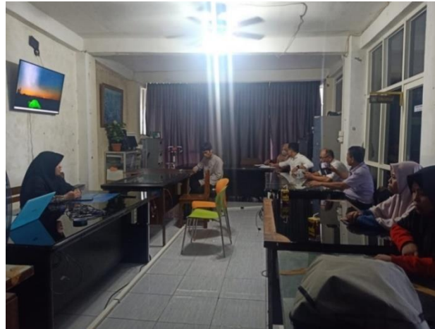
Gambar 3. Pelaksanaan Quiz Gaya Belajar

Berikut hasil tes quiz belajar yang diperoleh oleh 12 guru-guru SMK Madani Makassar dapat dilihat pada diagram dibawah ini,