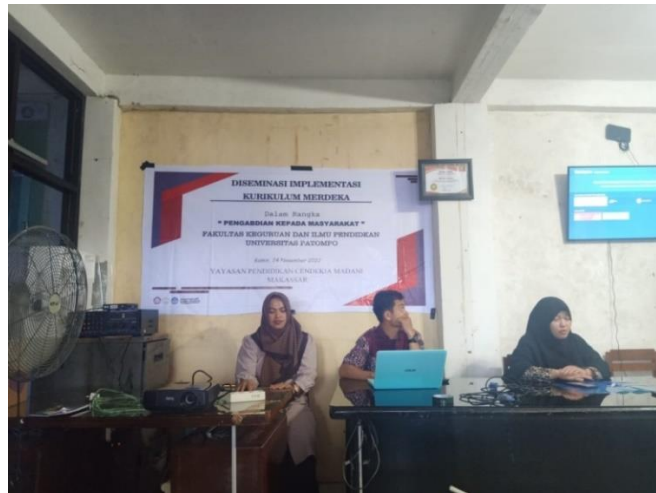
Gambar 1. Pemateri dan Moderator

Berikut dokumentasi saat pemberian materi pertama mengenai kelebihan dan kekurangan dari Kurikulum Merdeka Belajar.