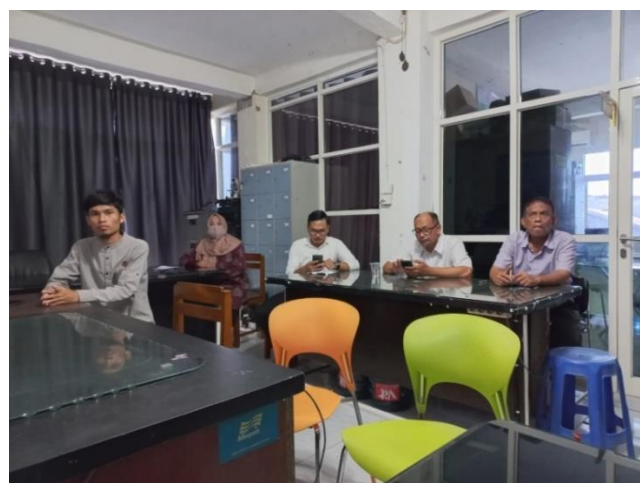
Gambar 2. Peserta Menyimak Materi

Setelah pemberian materi pertama, dilanjutkan dengan pelaksanaan praktik dengan cara menjawab quiz gaya belajar. Tujuan pelaksanaan tes ini untuk mengenal karakteristik Peserta Didik sebagai upaya untuk menentukan kelayakan penerapan atau implementasi kurikulum merdeka (IKM).