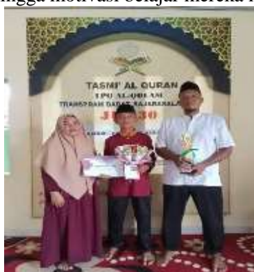
Gambar 3. Penghargaan bagi peserta didik yang menyelesaikan hafalan Juz 30

Lomba tilawah dan adzan memberikan kesempatan kepada anak-anak untuk mengekspresikan kemampuan mereka dalam membaca Al-Qur'an dan mengumandangkan adzan dengan baik dan benar. Kegiatan ini secara langsung melatih keberanian mereka tampil di depan umum, sekaligus menumbuhkan rasa bangga dan cinta terhadap ajaran Islam. Sementara itu, lomba hafalan surah dan cerdas cermat Islami tidak hanya mengasah daya ingat dan pengetahuan agama anak, tetapi juga mendorong mereka untuk lebih mendalami isi Al-Qur'an dan memahami nilai-nilai Islam secara lebih mendalam. Selain kegiatan tersebut, TPQ Al-Qolam juga memberikan penghargaan khusus kepada peserta didik yang berhasil menyelesaikan hafalan Juz 30. Penghargaan ini bukan sekadar simbolis, melainkan merupakan dorongan intrinsik yang sangat penting bagi santri untuk terus giat belajar dan berusaha mencapai target hafalan mereka. Dengan adanya penghargaan ini, anak-anak merasa dihargai atas usaha dan prestasi mereka, sehingga motivasi belajar mereka meningkat secara signifikan.