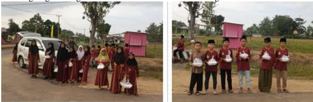
Gambar 2. Program berbagi takjil setia bulan Ramadhan

moral kepada teman-teman mereka yang sedang mengalami kesulitan. Selain itu, pada bulan Ramadhan, TPQ Al Qolam juga mengadakan kegiatan berbagi takjil kepada masyarakat sekitar. Kegiatan ini menjadi momen yang sangat berharga bagi anak-anak untuk belajar tentang pentingnya berbagi, keikhlasan, dan kepedulian terhadap sesama, terutama di bulan suci yang penuh berkah. Anak-anak diajak untuk aktif berpartisipasi dalam menyiapkan dan membagikan takjil, sehingga mereka dapat merasakan langsung kebahagiaan saat memberi dan membantu orang lain.