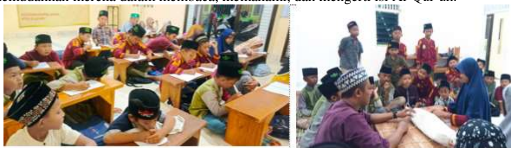
Gambar 1. Kegiatan TPQ Al_Qolam

TPQ Al-Qolam memberlakukan metode pembelajaran dan berbagai kegiatan yang bertujuan untuk membentuk karakter anak. Pada hari-hari biasa, anak-anak menerima pelajaran selama satu jam sesuai dengan kelompok masing-masing. Untuk menjaga suasana pembelajaran agar tetap kondusif, anak-anak yang mengaji iqro dan al-qur'an dibedakan. Adapun rangkaian kegiatan diawali dengan shalat berjamaah, kemudian anak-anak masuk kelas dan membaca doa sebelum mengantri untuk mendapatkan giliran mengaji. Selain mengaji, anak-anak juga belajar menghafal doa-doa harian dan surah pendek, serta praktik ibadah seperti shalat, adzan, wudhu, serta tata cara mengkafani jenazah. Berdasarkan pengamatan pola belajar dan wawancara dengan pengajar, dapat disimpulkan bahwa 80% anak-anak TPQ berhasil meningkatkan kemampuan membaca dan menghafal melalui teknik pembelajaran Iqro', yang memudahkan mereka dalam membaca, memahami, dan mengerti isi Al-Qur'an.