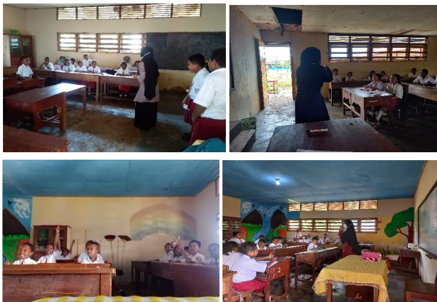
Gambar 1. Proses Belajar dan Mengajar Dasar-Dasar Bahasa Inggris kepada Siswa SD di Merauke

Berdasarkan hasil interview dan observasi awal kepada siswa dan guru, potensi penyebab kesulitan siswa dalam pembelajaran Bahasa Inggris yaitu SDM untuk mengajarkan Bahasa Inggris belum tersedia di sekolah tersebut, guru 1 “...di sini tidak ada SDM bisa Bahasa Inggris dan biasanya juga sekolah-sekolah muloknya lebih ke Bahasa Daerah...”. Di Indonesia pengajaran Bahasa Inggris pada tingkat sekolah dasar bersifat pilihan ( optional ). Ruang pengajaran Bahasa Inggris terdapat pada mata pelajaran muatan lokal. Pandangan muatan lokal merupakan perwujudan dari tiap daerah, tidak sedikit sekolah lebih memilih mengajarkan bahasa daerah daripada Bahasa Inggris, Icha (2020). Potensi lainnya adalah kondisi ekonomi orangtua siswa di sekolah tersebut, Guru 2 “...anak-anak di sini kebanyakan menengah juga kebawah...”.