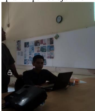
Gambar 4. Kegiatan Presentasi dan Diskusi Hasil Evaluasi Program PKM

Gambar ini menunjukkan kegiatan pengayaan dan tindak lanjut yang dilakukan oleh salah satu guru setelah sesi penyampaian materi dalam Program Kreativitas Mahasiswa (PKM). Terlihat guru sedang mencatat poin-poin penting dalam sebuah buku catatan sembari didampingi perangkat laptop dan ponsel sebagai sarana pendukung informasi. Aktivitas ini mencerminkan bentuk refleksi dan internalisasi materi yang telah disampaikan sebelumnya. Kegiatan tersebut penting dalam konteks implementasi pendidikan berbasis proyek, di mana guru berperan aktif dalam menyusun strategi lanjutan untuk penerapan pembelajaran yang lebih kontekstual dan bermakna. Proses dokumentasi ini juga mendukung peningkatan kompetensi profesional guru melalui pencatatan sistematis terhadap hasil kegiatan yang dapat diintegrasikan dalam praktik pembelajaran di kelas.