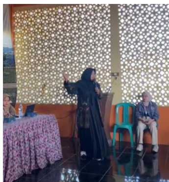
Gambar 2 Penyampaian Materi PKM

Pada gambar tersebut terlihat pemateri sedang berdiskusi santai dengan beberapa guru di MA Al Manshuriyah yang berlokasi di Kota Sukabumi, Jawa Barat. Pertemuan ini berlangsung sebelum dimulainya kegiatan resmi, sebagai bagian dari tahap persiapan untuk memastikan kelancaran penyampaian materi. Momen ini dimanfaatkan untuk membangun komunikasi awal, menyamakan persepsi terkait materi yang akan disampaikan, serta menjalin hubungan kolaboratif antara pemateri dan pihak sekolah. Suasana informal dan akrab mencerminkan adanya keterbukaan serta antusiasme dari para guru dalam menyambut kegiatan yang akan berlangsung.