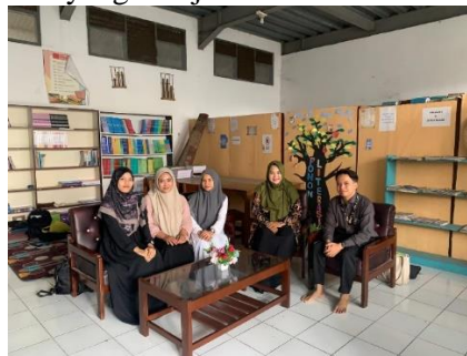
Gambar 1 Pemateri bertemu dengan Guru di MA Al Manshuriyah berlokasi di Kota Sukabumi Jawa Barat sebelum Acara dimulai

Temuan ini menunjukkan bahwa pendekatan pembelajaran berbasis proyek yang disertai pendampingan intensif dapat membantu guru dalam memahami dan mengimplementasikan Kurikulum Merdeka secara lebih kontekstual dan bermakna. Partisipasi penuh guru mencerminkan antusiasme terhadap pendekatan baru ini. Namun, keterbatasan waktu dan sarana menunjukkan pentingnya dukungan manajerial dan kebijakan sekolah. Hasil ini sejalan dengan temuan Marzuki dan Susilo (2021, p.88) yang menyatakan bahwa pelatihan berkelanjutan sangat penting untuk mendukung guru dalam implementasi kurikulum baru. Keterlibatan aktif siswa juga menunjukkan potensi pembelajaran proyek dalam menumbuhkan nilai-nilai karakter yang menjadi fokus Kurikulum Merdeka.