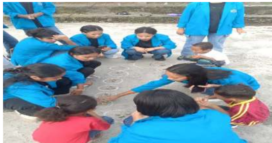
Gambar 9. Permainan Congklak

Hasil permainan ini merupakan lingkaran menggunakan kapur sebanyak 12 lingkaran kecil: 6 disetiap sisi, 2 lubang besar diujung sebagai lumbung. Permainan ini bergiliran mengambil semua isi satu lubang dan menyebar satu persatu di lubang berikutnya. Peserta yang dilibatkan berjumlah 10 orang. Hubungan dengan matematika yaitu memahami pola dan urutan dan operasi aritmatika ( penjumlahan dan pengurangan ). Dan juga mengajarkan penjumlahan sambil menabur biji.