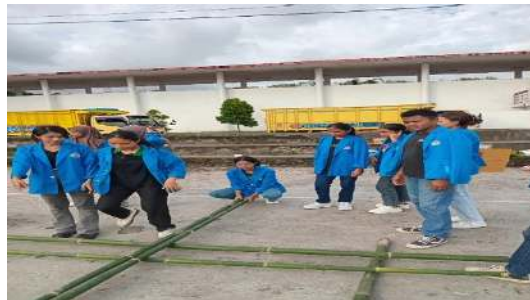
Gambar 11. Permainan Sanggu Alu

Hasil permainan ini merupakan permainan tradisional, bagi dua orang duduk berhadapan dengan kaki lurus masing-masing memegang ujung batang kayu dan kedua batang kayu diletakan sejajar dan bisa digerakan membuka dan menutup. Jumlah peserta yang dilibatkan berjumlah 8 orang. Hubungan dengan matematika yaitu pola bilangan, operasi hitung, pengukuran waktu dan panjang.