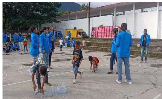
Gambar 5. Permainan Permainan Lompat Bentuk dan Ukur

Hasil permainan ini merupakan pembagian lapangan dengan menggambar atau meletakkan bentuk-bentuk geometri besar di tanah atau lantai dan tiap bentuk diberi tanda angka pada setiap sudut atau titik tertentu. Setiap kelompok secara bergantian melakukan gerakan lompat bentuk misalnya satu pemain mulai dari titik 1, melompat mengikuti garis bentuk sampai kembali ke titik awal. Permainan ini membutuhkan minimal 6 orang peserta. Hubungan permainan ini dengan matematika yaitu mengenal berbagai bentuk geometri ( segitiga, persegi, persegi panjang, dan lingkaran).