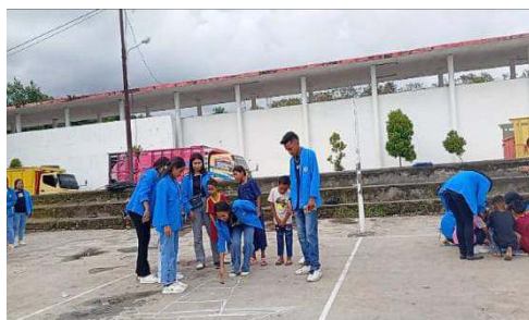
Gambar 3. Permainan Congklak

Hasil permainan ini merupakan pola umum yang terdiri dari 6 hingga 10 kotak yang tersusun secara vertikal dan horizontal membentuk seperti huruf T atau rumah. Permainan ini diundi untuk menentukan siapa yang bermain lebih dahulu. Permainan melempar batu kecil ke kotak pertama harus mendarat tepat di kotak yang tepat yang dituju tanpa menyentuh garis. Yang diperlukan dalam game ini berjumlah 10 orang. Hubungan game ini dengan matematika yaitu anak-anak belajar mengenali dan mengurutkan bilangan geometri pola kontak engkleng memperkenalkan bentuk persegi, garis lurus, simetris, dan pola.