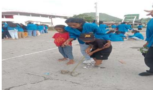
Gambar 12. Patuk Lele

Hasil permainan ini merupakan bagian dari menghitung jarak kayu ke lubang kecil cara bermain kayu kecil melambung dalam satu tim. Pemain yang dibutuhkan berjumlah 6 orang. Hubungan dengan matematika yaitu menghitung bilangan dan juga pengukuran.