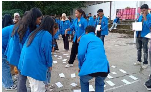
Gambar 7. Permainan Ogo

dilibatkan berjumlah 10 orang. Hubungan permainan ini dengan matematika merupakan media pembelajaran yang dirancang untuk memperkuat pemahaman siswa terhadap materi penjumlahan bilangan dalam mata pelajaran matematika.