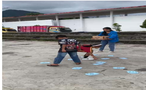
Gambar 1. Permainan Menangkap Angka Ajaib