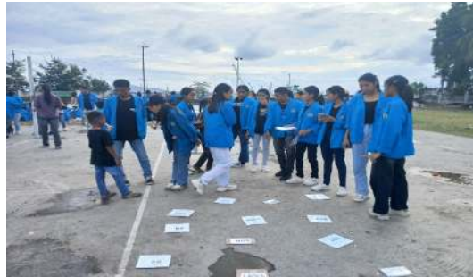
Gambar 10. Permainan Zona Hitung Seru

permainan ini dengan matematika yaitu memahami operasi hitung dasar berpikir cepat dan tepat, logika dan pemecahan masalah.