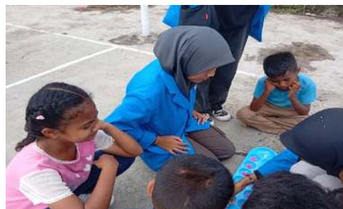
Gambar 2. Permainan Congklak

Hasil permainan ini merupakan tahap awal permainan dengan pemain pertama memilih lubang yang ingin dimainkan, selanjutnya pemain mengambil semua biji dari lubang yang dipilih dan dibagikan ke lubang-lubang berikutnya secara searah jarum jam. Jika biji terakhir jatuh ke lubang yang kosong maka pemain tidak mendapatkan biji tersebut dan jika biji terakhir jatuh ke lubang yang sudah berisi biji, maka pemain mendapatkan semua biji di lubang tersebut. Yang diperlukan dalam permainan ini berjumlah 5 orang. Hubungan permainan ini ke dalam matematika adalah penjumlahan, pengurangan dan pembagian secara praktis. Permainan ini juga bisa menjadi media pembelajaran matematika yang menarik dan menyenangkan bagi siswa SD.