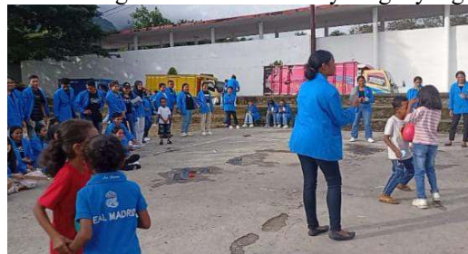
Gambar 6. Permainan Perburuan Bentuk Misterius

Hasil permainan ini merupakan setiap pasangan akan mengambil satu kartu petunjuk yang berisi gambar bentuki yang harus dicari dengan menggunakan dua tangan tetapi tidak boleh menghamburkan isi tumpukan keluar arena dan balon yang dipakai tidak terjatuh atau pecah. Jumlah peserta yang dibuthkan 2 orang atau lebih. Hubungan dengan matematika yaitu mengenal bentuk-bentuk geometri dasar secara menyenangkan dan meningkatkan fokus dan daya ingat yang kuat.