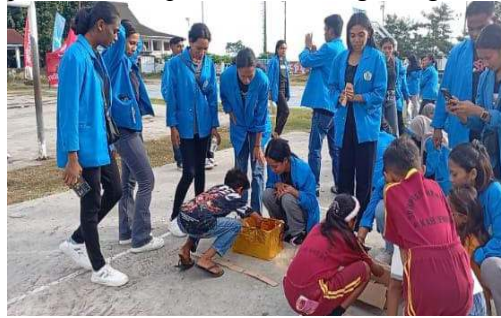
Gambar 4. Pertualangan Mencari Angka Berian Dalam Kotak Emas

berjumlah 5 orang. Hubungannya dengan matematika yaitu melatih memahami konsep penjumlahan sebagai proses menggabungkan 2 bilangan misalkan target 10 maka siswa mencocokkan kartu angka 2+8 , 6 + 10 , dapat mengasah kecepatan dan ketepatan dalam menghitung.