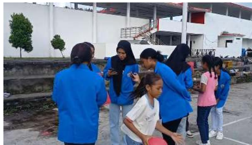
Gambar 8. Permainan Putaran Abadi

Hasil permainan ini merupakan kartu angka yang diberikan penjaga lalu berlari kedepan menuju titik letaknya jam analok. Dititik letak jarum jam para pemain akan memutar jarum jam yang sesuai dengan kartu yang akan mereka bawa pada saat memutar jarum jam. Peserta yang dilibatkan berjumlah 13 peserta. Hubungan dengan matematika yaitu memahami hubungan antara satuan waktu dengan memutar jarum jam dan pembelajaran yang menyenangkan.