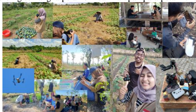
Gambar 3. Proses produksi – pengambilan footage bersama para petani semangka