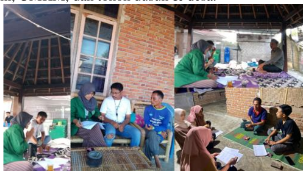
Gambar 2. Proses observasi dan wawancara para pekasi dan petani semangka di 3 dusun