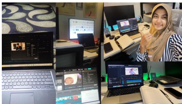
Gambar 4. Proses pengeditan – Pasca Produksi

Vidiodbranding yang kami hasilkan berdurasi ±30 menit, yang berisikan : Mengangkat kisah keseharian petani semangka di Dusun Pelambik, Menampilkan proses dari penanaman, perawatan, hingga panen semangka,serta disisipkan narasi visual yang mengangkat nilai-nilai lokal dan semangat petani serta beberapa aspirasi petani semangka kepada pemerintahan