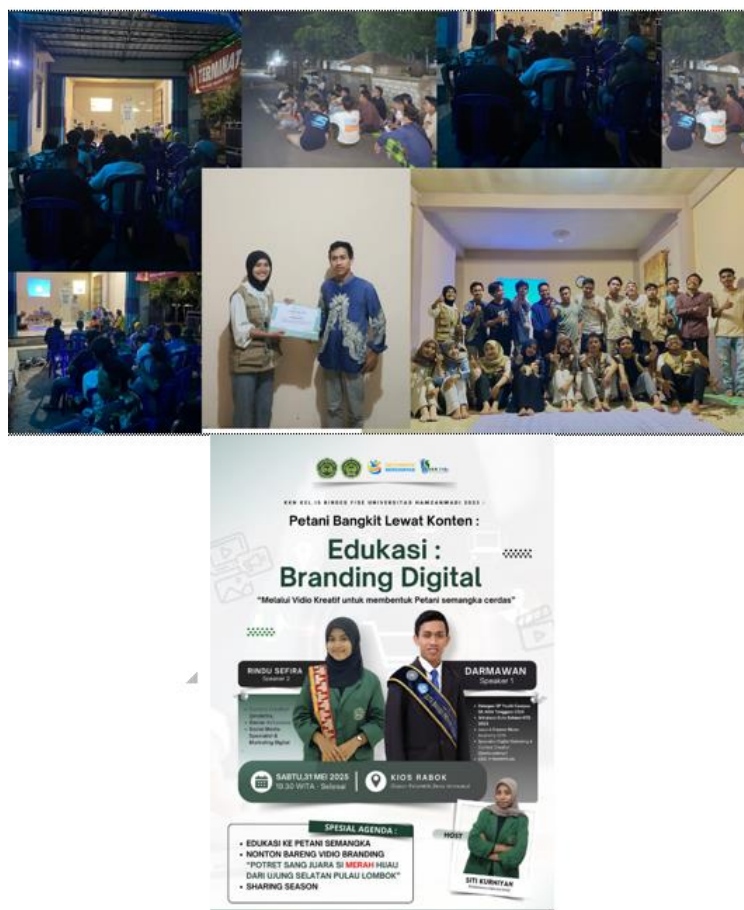
Gambar 7. Proses sosialisasi marketing-branding digital untuk petani semangka di Dusun Pelambik

Gambar di atas menggambarkan suasana antusias dari para petani semangka di Dusun Pelambik, Desa Jerowaru, saat mengikuti kegiatan Edukasi Branding Digital yang diselenggarakan oleh KKN Kelompok 15 Binde FISE Universitas Hamzanwadi pada Sabtu, 31 Mei 2025. Kegiatan ini berlangsung mulai pukul 19.30 WITA hingga selesai, bertempat di Kios Rabok, salah satu lokasi strategis di Dusun Pelambik.