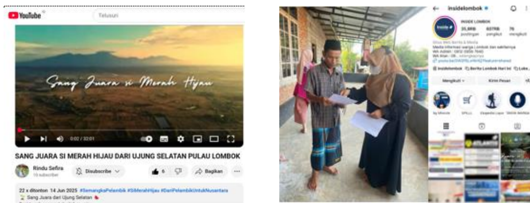
Gambar 6. Proses Distribusi dan promosi vidio branding