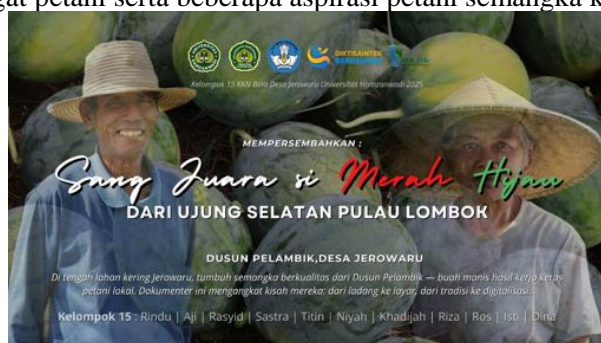
Gambar 5. Cover video branding petani semangka “Sang Juara – Si Merah Hijau dari Ujung Selatan Pulau Lombok”

Vidiodbranding yang kami hasilkan berdurasi ±30 menit, yang berisikan : Mengangkat kisah keseharian petani semangka di Dusun Pelambik, Menampilkan proses dari penanaman, perawatan, hingga panen semangka,serta disisipkan narasi visual yang mengangkat nilai-nilai lokal dan semangat petani serta beberapa aspirasi petani semangka kepada pemerintahan