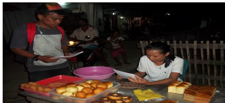
Gambar 1. Pedagang yang menjual makanan siap saji yang menjual barang dagangannya pagi serta sore hari.