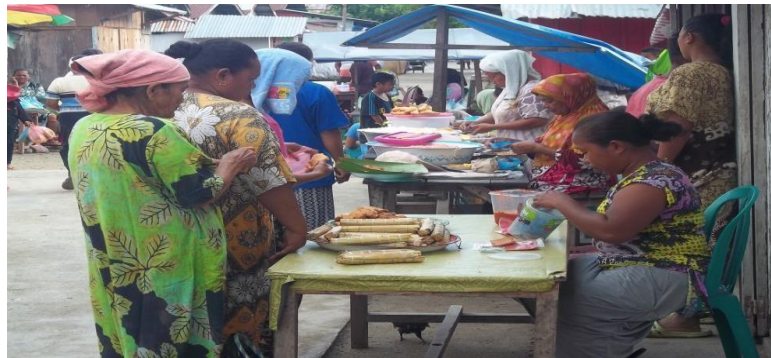
Gambar 3. Pedagang makanan yang lokasi berdagangnya menetap pada satu tempat dengan menggunakan meja semi permanen.

berdagang secara menetap sebanyak 11 orang dan ada pedagang yang sifatnya semi menetap ( semistatic ), pedagang ini mempunyai sifat menetap sementara, dimana tempat berdagangnya berpindah dari tempat tersebut sebanyak 19 orang.