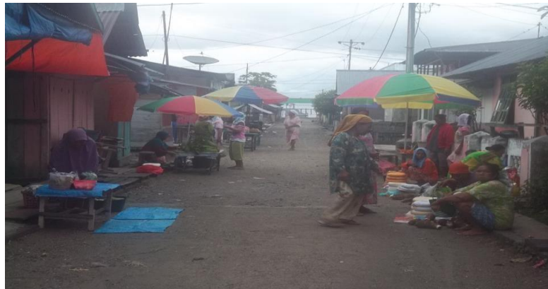
Gambar 4. Pedagang yang tidak menetap dengan hanya menggunakan alas karpet seadanya

Gambar tersebut menjelaskan kegiatan perdagangan yang dilakukan oleh pedagang ini, terkadang dilakukan pada pagi dan sore hari dan ada pula yang tidak menetap. Untuk melihat pola menetap tidaknya Pedagang ini, dengan melihat rutinitas jumlah berdagangnya hanya 1 kali dalam sehari yang dijawab langsung oleh 13 orang pedagang, dan 2 kali dalam sehari di sampaikan oleh 15 orang.