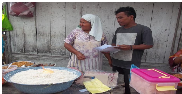
Gambar 2. Pedagang yang menjual makanan siap saji berupa nasi kelapa yang hanya berjualan pada pagi hari

Pedagang menjual barang dagangan secara rutin dengan barang dagangan yang sama jenis, atau dengan jenis yang berbeda. Dapat dilihat jenis barang dagangan berubah jenis atau tidak pada saat berdagang setiap hari, hal ini menunjukkan tanggapan pedagang tentang jenis dagangan yang berubah jenis ternyata mendapat tanggapan yang bervariasi dengan tanggapan yang menjawab berubah jenis sebanyak 7 orang, yang menjawab tidak berubah sebanyak 17 orang, serta yang menjawab ragu - ragu sebanyak 6 orang.