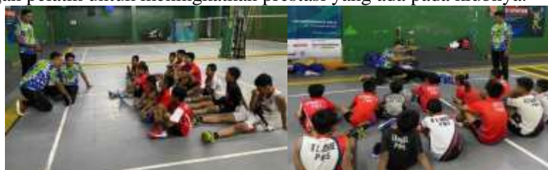
Gambar 1. Kegiatan Sosialisasi

Ditinjau dari segi pengetahuan, terdapat nilai tambah dari kegiatan ini yaitu pemanfaatan pemahaman penanganan pertama pada cedera olahraga dalam meningkatkan prestasi atlet. Pelaksanaan program ini juga bermanfaat bagi pengurus dan klub karena pengurus juga dapat berkomunikasi dan bekerjasama dengan pelatih untuk meningkatkan prestasi yang ada pada klubnya.