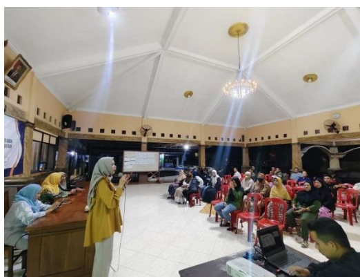
Gambar 1. Kegiatan Ceramah Interaktif