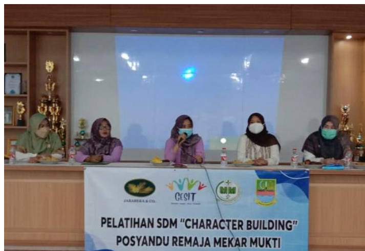
Gambar 1 : Tim Memberikan Penyuluhan

Kegiatan pengabdian masyarakat ini telah diimplementasikan pada bulan Maret 2023. Peserta dalam pelatihan ini terdiri dari kader Posyandu Remaja dan BumDes Mekarmukti yang berjumlah 51 orang. Pelaksanaan pelatihan bertempat di kantor Desa Mekarmukti. Sebelum memulai materi pelatihan, pembicara mengajak kader untuk berdiskusi terkait pemahaman mereka tentang saat ini dan memberikan Pretest tentang pemahaman kader posyandu remaja mengenai character building. Melalui proses diskusi dan pretest tersebut terlihat bahwa sebagian besar kader posyandu remaja belum dapat memahami tentang Character Building, sehingga belum mampu memaksimalkan cara-cara efektif dalam proses membentuk karakter diri.