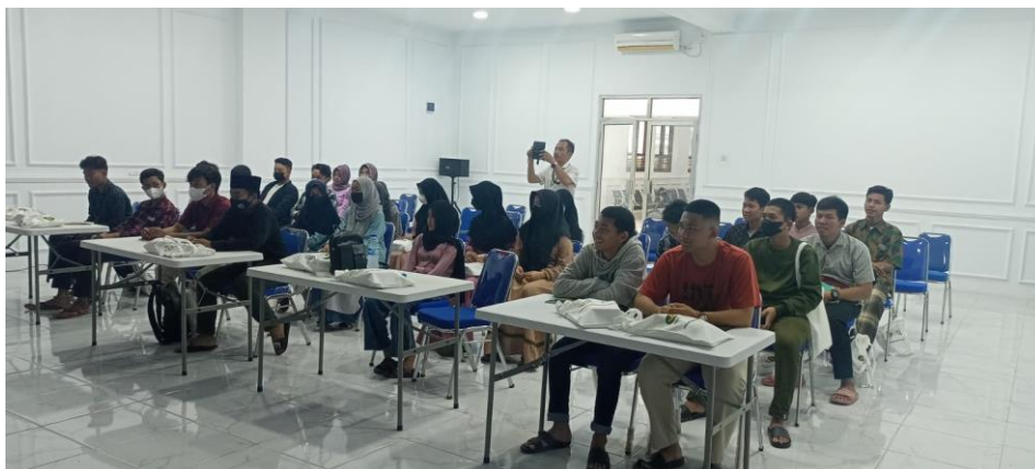
Gambar 2 : Peserta Pelatihan

Kemudian pembicara memberikan pelatihan yang berkaitan dengan Character Building dan dibagi menjadi dua pertemuan dengan materi yang berisi tentang definisi dan faktor-faktor terbentuknya Character Building, cara-cara pembentukan karakter positif dan kemudian kader mempraktikkan langsung. Setelah pemberian pelatihan kader posyandu remaja diberi posttest untuk melihat apakah ada peningkatan terhadap pengetahuan kader posyandu remaja berkaitan dengan Character Building agar dapat melihat sejauh mana kader posyandu remaja memperoleh manfaat dari pelatihan, apakah sudah dapat memahami materi dan kemudian mengaplikasikannya baik untuk diri sendiri ataupun untuk bisa dibagikan pemahaman tersebut terhadap teman-teman mereka.