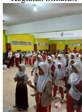
Gambar 4 : Mempraktikkan Gerakan Lagu Antibullying