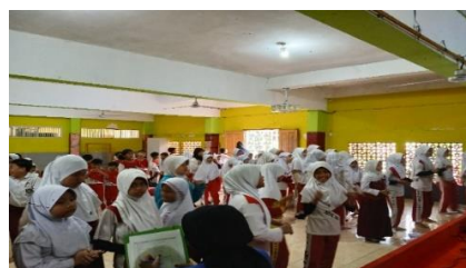
Gambar 2 : Kegiatan Simulasi