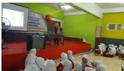
Gambar 1 : Kegiatan Sosialisasi

Tim pelaksana menyampaikan materi secara interaktif, menggunakan pendekatan yang dekat dengan dunia anak-anak. Selain ceramah ringan, digunakan permainan kelompok, kuis, dan role play untuk memperjelas pesan-pesan utama. Misalnya, dalam sesi role play, siswa diajak bermain peran menjadi pelaku, korban, dan penolong. Dari simulasi tersebut, anak-anak belajar memahami perasaan orang lain dan pentingnya menjadi teman yang peduli.