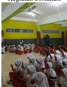
Gambar 3 : Siswa Menyimak Kegiatan Sosialisasi