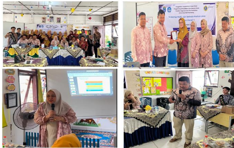
Gambar 1. Dokumen kegiatan workshop

Sebagai hasil dari pelatihan ini, setiap kelompok berhasil menyusun satu draft modul pembelajaran lengkap. Modul-modul yang dihasilkan kemudian dipresentasikan di akhir sesi untuk mendapatkan masukan dan umpan balik dari fasilitator maupun peserta lainnya. Secara umum, peserta menunjukkan peningkatan pemahaman dan keterampilan dalam menyusun modul, serta mampu mengaplikasikan prinsip-prinsip desain instruksional dengan baik.