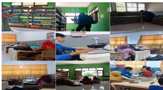
Gambar 3. Pendampingan Administrasi Sekolah.

Memperbaiki administrasi perpustakaan seperti, Melakukan peminjaman buku dan pengembalian buku, Mengelola data buku, merapikan buku-buku di perpustakaan dan membantu setiap kebutuhan administrasi di SD Negeri 17 Palu.