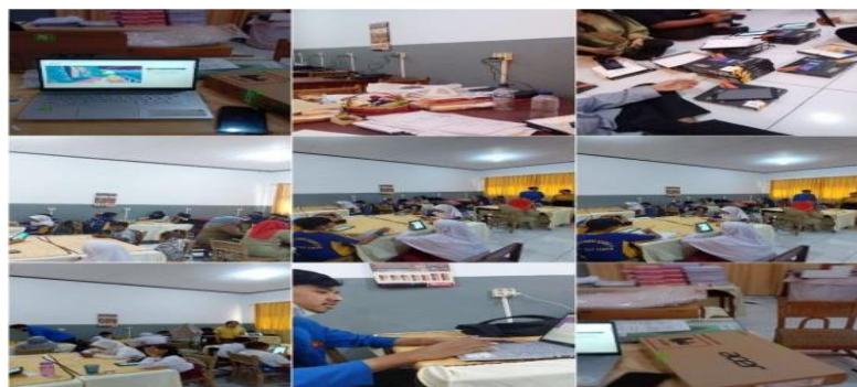
Gambar 2. Membantu Adaptasi Teknologi

Memaksimalkan pemanfaatan Teknologi Mengarahkan dan mendampingi tenaga pendidik/guru dalam pemanfaatan komputer, membimbing salah satu operator sekolah dalam pemanfaatan teknologi.