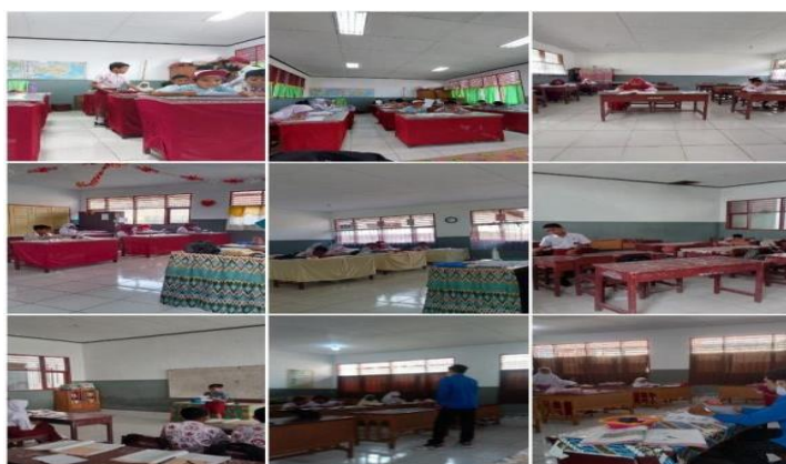
Gambar 1. Kegiatan Mengajar.

Membantu siswa-siswi dalam pembelajaran yang berfokus pada literasi dan numerasi. Mengajar/berkolaborasi dengan tenaga pendidik/guru dalam proses pembelajaran.