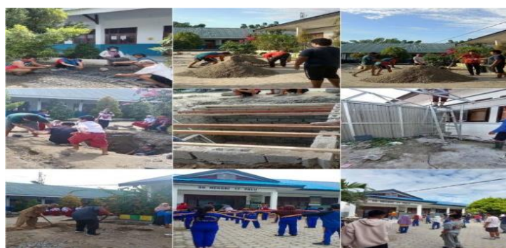
Gambar 4. Kerja bakti bersama dan pembuatan sumur resapan.

Kerja bakti bersama dan pembuatan sumur resapan.