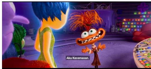
Gambar 1. Anxiety

Anxiety digambarkan sebagai sosok dengan gerakan cepat dan dominasi warna oranye muda, mencerminkan perasaan cemas yang berlebihan. Ini sejalan dengan studi Shaver et al. (1987) tentang hubungan visual dengan jenis emosi. Dari sudut pandang semiotik, warna oranye melambangkan energi, kewaspadaan, dan emosi yang seringkali mendominasi, menyampaikan karakteristik yang mendesak dan mengganggu. (Zhu et al., 2022) Desain karakternya menunjukkan gerakan yang gelisah, rambut yang bergerak layaknya bulu, mata yang besar, dan bentuk yang mencolok, secara semiotik menandakan sifat yang resah dan tidak stabil. Kecemasan menjadi elemen sentral dalam film, dengan cara yang dramatis mengubah suasana emosional Riley dan memengaruhi pengembangan " Sense of Self " yang baru.