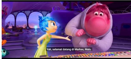
Gambar 3. Embarrassment

Embarrassment berwarna merah muda, menandakan nuansa kemerahan dan ketidakstabilan. Dalam aspek semiotik, ini menunjukkan perasaan malu yang sejati dan keinginan untuk menyembunyikan diri. Kecenderungan Embarrassment untuk menutupi wajahnya dengan hoodie dan ukuran yang besar secara semiotik menyampaikan kehendak untuk tidak tampak meskipun sangat sulit untuk diabaikan. Rasa malu mencerminkan kesadaran diri yang lebih dalam saat berada di lingkungan sosial, menekankan ketidaknyamanan sosial dan ketidakberdayaan pribadi.