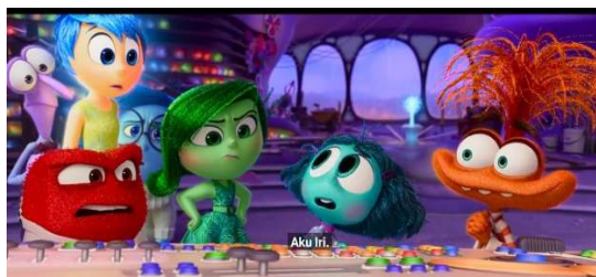
Gambar 2. Envy

Envy ditampilkan dengan warna teal (biru-hijau), yang dapat dipahami sebagai gabungan dari kesedihan (biru) dan rasa jijik (hijau) atau perbandingan. Dalam konteks semiotik, ini mencerminkan rasa ketidakpuasan dan perbandingan sosial yang mendalam. Ukuran kecil dari Iri dan matanya yang besar secara visual melambangkan perasaan rendah diri saat membandingkan diri dengan orang lain,