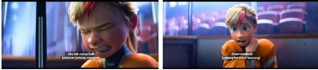
Gambar 6. Adegan Riley Mengasingkan Diri

Gambar 6 adalah adegan ketika Riley mengasingkan diri karena dipengaruhi oleh Anxiety dan Envy menggambarkan konflik antara keinginan untuk diterima dan rasa takut gagal. Ini menggambarkan teori konflik intrapersonal oleh Harter (1999), di mana remaja mengalami konflik antara citra ideal dan realitas sosial. Rasa iri memicu perasaan tidak cukup baik dan perbandingan dengan teman sebaya, terutama dalam konteks media sosial dan pencarian validasi eksternal. Rasa malu ( Embarrasement ) merusak kepercayaan diri Riley dan interaksinya, sering kali muncul dari kesadaran diri yang meningkat dalam situasi sosial. Emosi-emosi ini secara kolektif berkontribusi pada perjuangan remaja dengan rasa tidak mampu dan keinginan untuk memiliki.