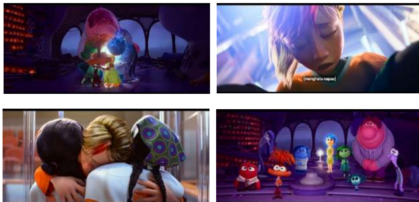
Gambar 7. Adegan Penerimaan Diri

Film ini dengan baik menggambarkan adanya siklus umpan balik negatif yang terjadi antara perasaan remaja, interaksi sosial, dan pembentukan identitas diri. Munculnya rasa Anxiety , Envy , dan Embarrasement , yang dipicu oleh perubahan dalam otak dan pergeseran perhatian kepada teman sebaya, mendorong Riley untuk terlibat dalam tindakan sosial yang tidak sehat, seperti meninggalkan teman-teman lamanya dan mencari pengakuan dari luar melalui perilaku berisiko, demi mendapatkan penerimaan. Tindakan ini pada akhirnya menguatkan rasa tidak mampu dan pandangan diri "Saya tidak layak". Pandangan diri yang salah ini kemudian semakin memperbesar emosi baru, terutama rasa cemas, yang mengendalikan perilaku Riley, dan menciptakan spiral negatif. Pertentangan antara emosi lama dan baru di dalam benak Riley berfungsi sebagai metafora untuk konflik batin yang dialaminya. Dalam kondisi ini, "identitas" Riley yang sejati tertekan, yang berujung pada perilaku yang asing dan tidak dikenali. Ini menekankan betapa rapuhnya pembentukan identitas selama masa remaja. Film ini secara visual menggambarkan bagaimana emosi yang tidak terkelola, yang dipicu oleh tekanan sosial, dapat menghasilkan siklus yang merusak harga diri dan kemampuan untuk beradaptasi secara sosial dengan baik.