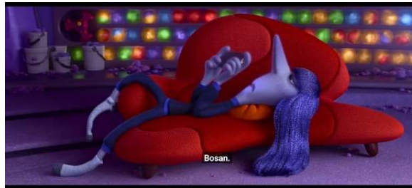
Gambar 4. Ennui

Ennui dengan nuansa abu-abu keunguan melambangkan rasa bosan, ketidakpedulian, dan kurangnya semangat. Sikap Ennui yang tidak bertenaga dan penggunaan ponsel untuk mengontrol konsol secara simbolik menggambarkan kebosanan dan ketidakperhatian. Ennui mencerminkan perasaan acuh tak acuh dan minimnya rangsangan mental umum di kalangan remaja, yang sering kali terlihat dari sikap mereka yang dingin.