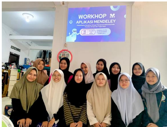
Gambar 3. Tim Pengabdian foto bersama Santri

Tim Pengabdian dan santri foto bersama. Pada pelatihan ini, santri sangat antusias dan memberikan respon yang positif.