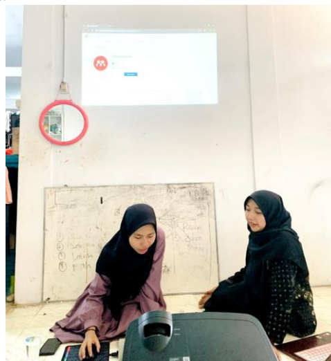
Gambar 2. Tim Pengabdian Memaparkan Materi

Kegiatan pelatihan dilaksanakan secara tatap muka di Pondok Pesantren Al Munawwir Putri Komplek L Krpyak Yogyakarta. Para santri yang mengikuti pelatihan adalah santri yang sedang berkuliah di Semester 1-6 dari berbagai institusi. Tim Pengabdian memaparkan materi pelatihan (bisa dilihat pada gambar 2) seperti pengenalan tentang Mendeley sebagai alat pengelola literatur, pemateri memaparkan secara langsung panduan instalasi Mendeley, cara mengoperasikan Aplikasi Mendeley dalam membuat daftar pustaka.