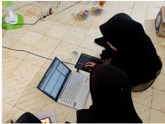
Gambar 3. Santri mempraktikkan penggunaan aplikasi dan di pantau oleh Tim

Santri satu persatu mempraktikkan cara menggunakan Aplikasi Mendeley yang sebelumnya sudah dipraktikkan oleh tim pengabdian. Santri mendownload salah satu jurnal online, kemudian menginput jurnal tersebut kedalam aplikasi, melengkapi data jurnal dan bagaimana memunculkan refrensi tersebut pada daftar pustaka.