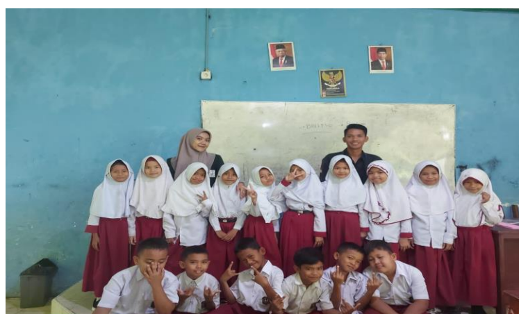
Gambar 3 Kondisi salah satu kelas