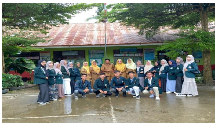
Gambar 1 Studi Pendahuluan

Berdasarkan hasil pembahasan terlampir dokumentasi penelitian Peningkatan Upaya Peningkatan Kinerja Guru Sekolah Dasar Melalui Manajemen Kepala Sekolah di SDN Pengantingan Batang Arah Tapan.