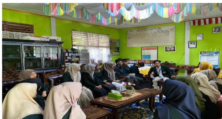
Gambar 2 Pengumpulan data dan observasi