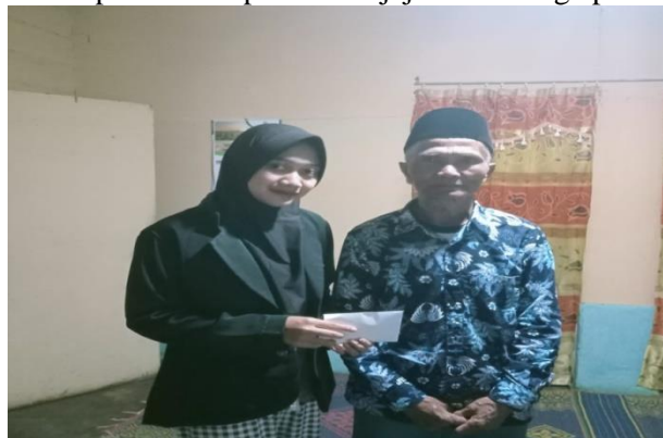
Gambar 1 Studi pendahuluan penyerahan BLT