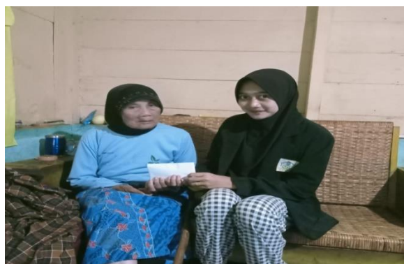
Gambar 2 Penyerahan Bantuan Langsung Tunai