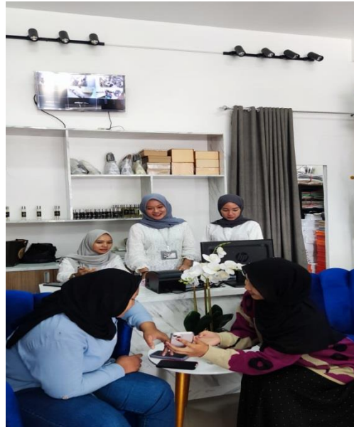
Gambar 3 memberikan pendampingan GMaps