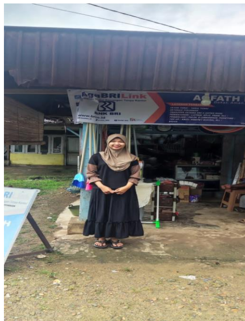
Gambar 4 Mengunjungi usaha secara langsung

Pada pelaksanaan kegiatan akhir, yang harus diperhatikan adalah pemantauan serta pendampingan kurang lebih 1 bulan. pemantauan dan pendampingan ini bertujuan untuk mengetahui perkembangan usaha yang awalnya konvensional menjadi digital dan proses pemantauan dan pendampingan dilakukan penulis mendatangi lokasi pelaku usaha UMKM satu per satu sehingga akan terfokuskan pada perkembangan dan hasil pelaksanaan. Hasil perkembangan dapat dilihat pada Tabel.