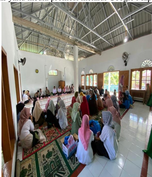
Gambar 2. Sosialisasi Google Maps

Pelaksanaan kegiatan pertama dari pelaksanaan pengabdian kepada mitra UMKM yaitu menjelaskan terkait pemasaran produk. Promosi adalah suatu komunikasi dari penjual dan pembeli yang berasal dari informasi yang tepat yang bertujuan untuk merubah sikap dan tingkah laku pembeli, yang tadinya tidak mengenal menjadi mengenal sehingga menjadi pembeli dan tetap mengingat produk tersebut (Budi Utomo, 2021). Pemasaran atau promosi memiliki beberapa strategi yaitu manual dan digital. Contoh strategi manual yaitu promosi langsung ke masyarakat, penyebaran pamflet atau brosur, sedangkan strategi digital yaitu dimana strategi promosi yang menggunakan media sosial diantaranya whatsapp, instagram, facebook. Namun, semakin berkembangnya dunia promosi di bidang digital menciptakan ide kreatif yaitu media promosi melalui Google Maps.