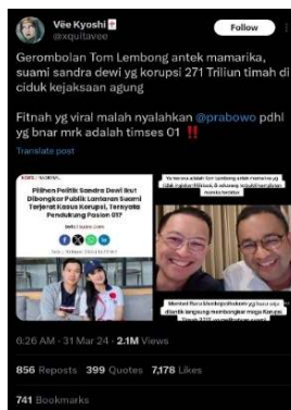
Gambar 3. Contoh Buzzer Politik dalam Pemilu 2023

Kehadiran buzzer politik dalam Pemilu dapat memengaruhi sistem demokrasi dan nilai HAM di Pemilu Indonesia. Dilansir dari Kompas (19/03/23), Menteri Komunikasi dan Informatika (Menkominfo) Budi Arie Setiadi mengungkapkan bahwa di Pemilu 2024 hampir 92% kebisingan di media sosial itu dibuat oleh para buzzer . Hal ini menunjukkan bahwa buzzer politik memiliki dampak yang signifikan terhadap Pemilu. Buzzer politik dalam konteks Pemilu seringkali digunakan untuk menjatuhkan lawan calon capres-cawapres. Informasi yang disebarluaskan berkaitan dengan bias, disinformasi, dan black campaign . Akun-akun buzzer akan menggunakan media sosial untuk menyebarkan narasi dengan tujuan menjatuhkan lawan calon capres-cawapres. Akan tetapi Buzzer juga dapat dilakukan untuk mengumpulkan dan mengarahkan dukungan masyarakat terhadap calon capres-cawapres yang didukung oleh akun buzzer tersebut.