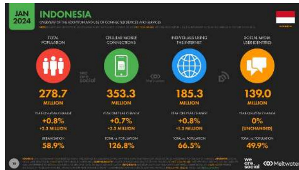
Gambar 1. Data Pengguna Internet dan Media sosial di Indonesia Tahun 2023

Pertumbuhan teknologi digital di Indonesia saat ini terjadi secara signifikan. Hal ini tercermin dalam meningkatnya penggunaan internet di Indonesia. Menurut laporan terbaru dari datareportal.com (21/03/23) dengan bantuan We Are Social dan Meltwater, pengguna internet di Indonesia terdapat 185,3 juta orang pada Januari 2023. Jumlah ini merupakan 66,5% dari total populasi Indonesia. Pengguna media sosial aktif di Indonesia terdapat 139 juta orang di Januari 2023. Jumlah ini merupakan 49,9% dari total populasi di Indonesia.