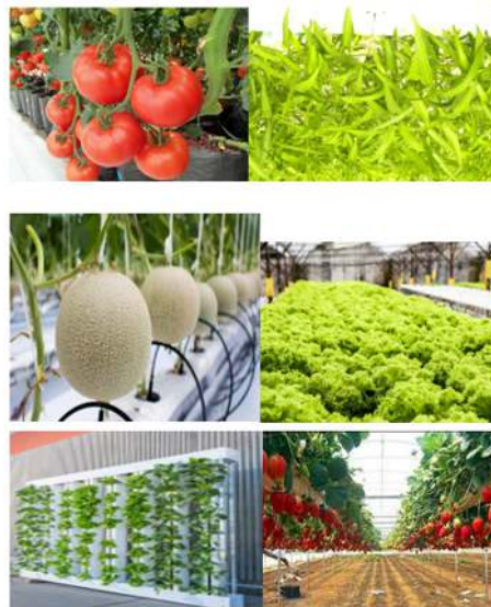
Gambar 4 Tanaman sayur dan buah dengan media hidroponik

Ada beberapa jenis tanaman sayur dan buah bisa tumbuh dalam media hidroponik. Tetapi tidak semua bisa tumbuh dan menghasilkan buah dengan baik dan sehat. Karena ada jenis tanaman tertentu, meskipun bisa tumbuh dengan subur tetapi tidak bisa berbuah jika ditanam dengan cara hidroponik. Tingkat keberhasilan dalam mengembangkan tanaman hidroponik juga berbeda-beda, ada yang mudah, sulit, bahkan ada yang masih belum berhasil.