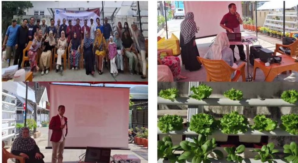
Gambar 4. Proses Pelatihan “Overview Hydroponik System”

Tim pengabdian merencanakan tahap kedua kegiatan dengan fokus pada pengadaan tambahan modul hidroponik dan pelatihan pemasaran berbasis digital.