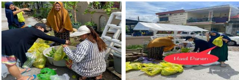
Gambar 1. Hasil Panen Hidroponik