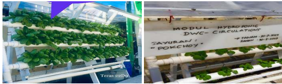
Gambar 2. Tanaman sayur dalam media hidroponik

tinggal di perkotaan yang memiliki lahan terbatas. Solusi bagi yang tetap ingin menanam tanaman buah di lahan yang sempit bisa menggunakan cara hidroponik.