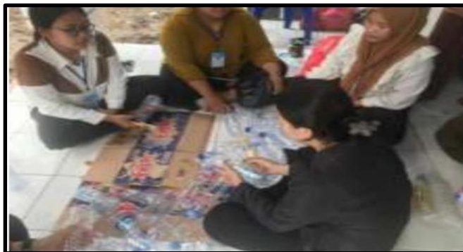
Gambar 1. Menyiapkan Botol Plastik

Lalu sebelum mengakhiri kegiatan, tim pengabdian kepada masyarakat melakukan evaluasi dengan membagikan kuisioner kepada peserta dan orang tua untuk mengetahui sejauh mana tanggapan mereka terhadap kegiatan yang sudah dilakukan.