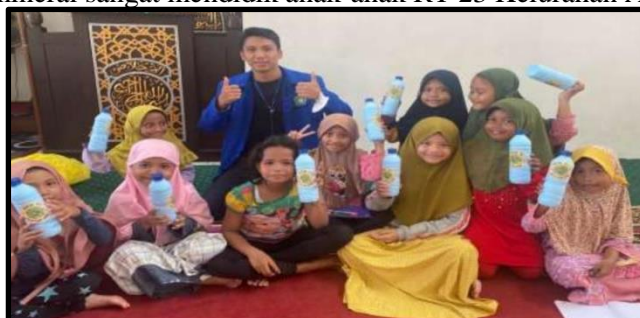
Gambar 4. Anak-anak dengan Kreasi Celengan

Tahap ini tim pengabdian kepada masyarakat melakukan evaluasi dengan membagikan kuisioner kepada anak-anak peserta kegiatan dan orang tua untuk mengetahui sejauh mana tanggapan mereka terhadap kegiatan yang sudah dilakukan. Tanggapan positif diberikan oleh orang tua dan juga pihak RT 23 karena sosialisasi gerakan gemar menabung (gemabung) dengan membuat celengan dari bahan bekas botol plastik air mineral sangat mendidik anak-anak RT 23 Kelurahan Air Hitam.