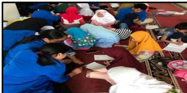
Gambar 3. Anak-anak Membuat Celengan

lakukan dari menabung di celengan lalu membuka rekening sendiri dengan ijin dan bantuan orang tua mereka di suatu bank. Kegiatan pada tahap ini kemudian dilanjutkan dengan demonstrasi membuat celengan dari botol plastik bekas air mineral oleh salah satu tim pengabdian kepada masyarakat. Setelah itu kegiatan dilanjutkan dengan anak-anak peserta kegiatan membuat celengan dengan kreasi mereka masing-masing.