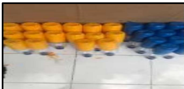
Gambar 2. Botol Plastik yang Akan Dikreasikan menjadi Celengan

Sosialisasi gerakan gemar menabung dengan membuat celengan dari botol plastik bekas air mineral bersama anak-anak warga RT 23 dilaksanakan pada 07 Juli 2023 di Masjid Al-Muttaqin Kelurahan Air Hitam. Sosialisasi ini merupakan salah satu aksi untuk mengurangi sikap konsumtif pada anak-anak, setelah dilakukannya sosialisasi mengenai kegiatan menabung diharapkan anak-anak memperoleh pemahaman kegiatan menabung dengan harapan mereka dapat menerapkan kebiasaan menabung sebagai kebiasaan yang baik. Sehingga anak-anak ketika dewasa nanti dapat lebih baik dalam mengelola keuangan mereka, karena sudah terbiasa menyisihkan uang untuk ditabung sejak dini, karena menurut (Krisdayanthi, 2019) gemar menabung perlu diterapkan sejak dini dikarenakan anak yang terbiasa mengelola uang sejak kecil akan berdampak positif pada pengelolaan keuangan saat mereka dewasa.