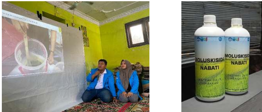
Gambar 2. Penyampaian materi pembuatan moluskisida nabati (kiri), demonstrasi produk untuk petani (kanan)

Pada akhir pemaparan materi banyak petani antusias untuk mengikuti sesi diskusi. Melalui diskusi tersebut, ternyata banyak petani yang mengalami serangan hama keong mas dengan intensitas serangan yang tinggi. Kemudian salah satu petani menyampaikan sebuah pertanyaan tentang langkah yang bisa diterapkan untuk mengurangi telur keong mas. Menanggapi hal tersebut metode pengendalian yang paling sederhana adalah dengan mengambil dan membuang telurnya. Selain itu, aplikasi moluskisida di atas dapat dilakukan setiap pagi dan sore sebagai suatu langkah pencegahan.