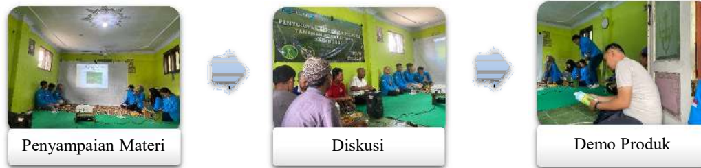
Gambar 1. Alur Kegiatan Penyuluhan Pertanian Kelompok Tani Sumber Rejeki

mengikuti metode sebelumnya yang pernah dilakukan (Nurvitasari et al., 2024; Nurvitasari et al., 2024) dan penyuluhan (Siswadi et al., 2025), antara lain ceramah, diskusi, dan demo produk. Melalui kombinasi metode tersebut, diharapkan para petani dapat lebih aktif terlibat dalam proses pembelajaran serta lebih mudah memahami materi yang diberikan, sehingga penerapannya di lapangan menjadi lebih sederhana dan efektif (Dinata, Sukri, et al., 2024). Demo produk yang dimaksud adalah membawakan petani produk jadi untuk diberikan kepada petani. Alur kegiatan penyuluhan disajikan pada Gambar 1.