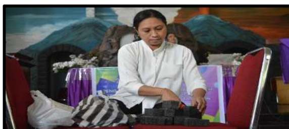
Gambar 7. Melatih membuat buket bunga sebagai salah usaha keterampilan remaja gereja