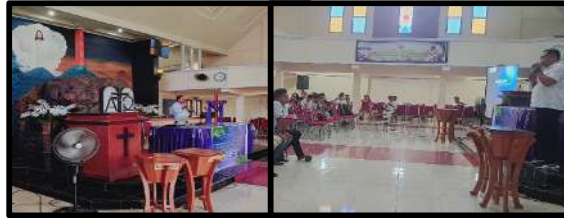
Gambar 4. Sosialisasi Literasi Bahasa yang Etis bagi Peserta dalam bermedia digital