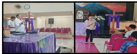
Gambar 2. Sosialisasi Pembangunan Karakter remaja Gereja