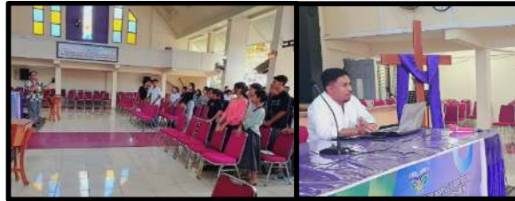
Gambar 1. Sosialisasi Pengenalan Dasar-Dasar Iman Kristen

spiritualitas dalam kehidupan sehari-hari. Untuk menjawab tujuan di atas, maka terdapat 3 Komponen utama yang ditentukan antara lain (1) Pengenalan Dasar-Dasar Kepemimpinan remaja Kristen (a) Pemahaman tentang Alkitab dan nilai-nilai kepemimpinan Kristiani, (b) Memperkenalkan strategi kepemimpinan remaja Kristen secara sederhana dan menarik. Komponen ke (2) tentang Pembangunan Karakter Spiritual Remaja Kristen meliputi (a) Pembinaan nilai-nilai seperti kasih, kejujuran, dan tanggung jawab dan (b) Latihan etika Kristiani dalam hubungan sosial, keluarga, dan lingkungan, dan komponen yang ke (3) tentang Aktivitas Rohani remaja Kristen meliputi mengadakan skenario ibadah kreatif (misalnya ibadah Kreatif remaja terinspirasi dari sumber sumber Alkitab dengan berbagai permainan rohani) serta pendalaman pengalaman remaja sebagai pengalaman spiritual iman. Pada proses ini, definisi, tujuan, dan praktek pembinaan spiritualitas dan keunggulannya dapat dijelaskan.