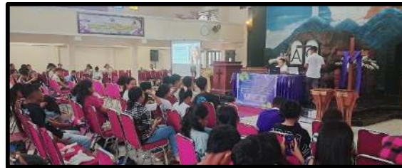
Gambar 5. Praktek Menggunakan Gadget dalam bermedia digital bagi peserta