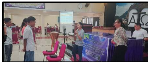
Gambar 3. Latihan Ibadah kreatif dengan permainan rohani