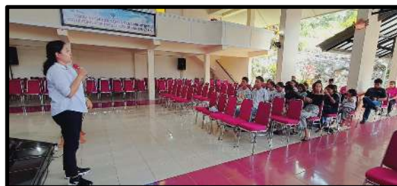
Gambar 6. Sosialisasi kewirausahaan (enterpreneur) muda Gereja

Diawali dengan memahami peran generasi muda dalam mendukung pertumbuhan ekonomi berbasis iman Kristen serta tantangan dan peluang bagi pemuda Kristen di era digital untuk menjadi wirausahawan yang beretika dan berdaya saing. Dengan tujuan pelatihan adalah (1) Menumbuhkan jiwa kewirausahaan yang berlandaskan nilai-nilai Kristiani, (2) Meningkatkan kemampuan peserta dalam memulai dan mengelola usaha secara profesional, (3) Mendorong pemanfaatan teknologi digital untuk keberhasilan bisnis. Adapun 3 Komponen utama yang disampaikan dan dilatih sebagai berikut (1) Penguatan Spiritualitas dalam Kewirausahaan meliputi (a) Pemahaman bahwa kewirausahaan adalah panggilan dan pelayanan, (b) Nilai-nilai etika Kristen dalam menjalankan bisnis: kejujuran, keadilan, dan tanggung jawab sosial. Komponen ke (2) yakni Pembekalan Dasar Kewirausahaan meliputi (a) Konsep dasar kewirausahaan: perencanaan bisnis, inovasi, dan pengambilan risiko, (b) Identifikasi peluang usaha berdasarkan kebutuhan dan potensi pasar. Serta komponen ke (3) yakni Strategi Pengembangan Usaha meliputi (a) Teknik pemasaran modern, termasuk strategi branding dan storytelling, (b) Pemanfaatan media sosial dan e-commerce untuk memperluas jangkauan pasar, (c) Penggunaan alat dan aplikasi untuk manajemen usaha. Pada proses ini, definisi, tujuan, dan praktek kewirausahaan (enterpreneur) muda Gereja dapat dijelaskan.