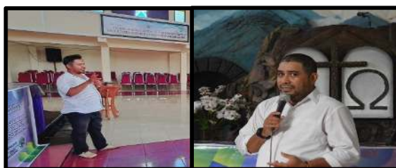
Gambar 8. Sosialisasi dan pelatihan Karya Tulis Ilmiah Remaja Melalui keterampilan Strategi Metakognisi