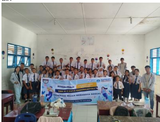
Gambar 1 Pelaksanaan Pengabdian Kepada Masyarakat

Keberhasilan ini selaras dengan tujuan utama kegiatan untuk menciptakan "generasi bijak bermedia sosial" yang mampu memaksimalkan potensi positif media sosial sekaligus meminimalkan dampak negatifnya, demi terwujudnya ruang digital yang lebih sehat dan aman. Antusiasme siswa selama kegiatan mengindikasikan bahwa pesan yang disampaikan dapat diterima dengan baik, sehingga diharapkan dapat memengaruhi perilaku mereka di kemudian hari menuju penggunaan media sosial yang lebih bertanggung jawab.