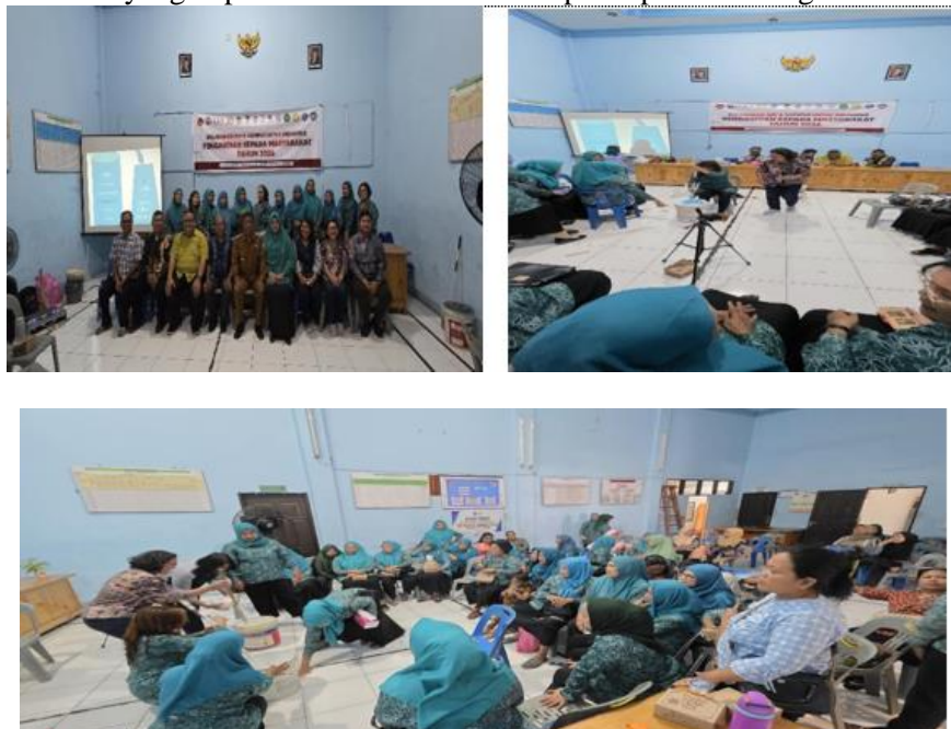
Gambar 1. Foto-Foto Kegiatan Pengabdian Masyarakat

Kegiatan ini memberikan efek pemberdayaan yang nyata, terutama dalam peningkatan kepercayaan diri dan keterampilan teknis peserta. Selain itu, pelatihan ini juga membuka peluang wirausaha baru di desa yang dapat membantu menambah pendapatan keluarga.