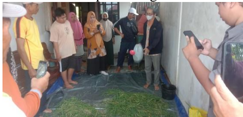
Gambar 3. Praktek Pembuatan Kompos Berbasis Mikroba

Pemanfaatan pupuk organik hasil fermentasi jerami dengan bantuan Trichoderma tidak hanya menekan ketergantungan petani terhadap pupuk anorganik, tetapi juga mengurangi biaya produksi. Pupuk organik ini terbukti dapat meningkatkan efisiensi penggunaan pupuk anorganik secara signifikan, sehingga penggunaannya dapat diminimalkan tanpa menurunkan hasil panen. Keberhasilan petani dalam menyerap pengetahuan dari kegiatan penyuluhan sangat bergantung pada keterampilan, ketelitian, keseriusan, ketekunan, dan kemauan untuk belajar. Oleh karena itu, pembinaan berkelanjutan oleh pihak-pihak yang kompeten, seperti penyuluh pertanian, dosen, maupun lembaga terkait, menjadi sangat penting. Dukungan dari lembaga pemerintah memiliki peran strategis, karena petani tidak dapat berinovasi dan berkembang secara mandiri tanpa dukungan dan fasilitasi dari berbagai pihak.