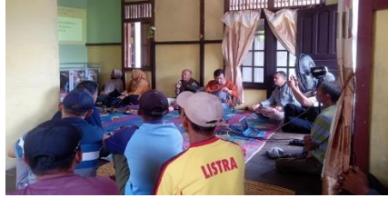
Gambar 1. Kegiatan Penyuluhan