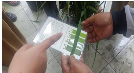
Gambar 2. Praktek Penggunaan Bagan Warna Daun

Demonstrasi pemanfaatan bagan warna daun dilakukan dengan mencocokkan warna daun padi terhadap skala warna yang tersedia pada alat. Penggunaan bagan warna daun ini berfungsi sebagai indikator praktis untuk menentukan kebutuhan nitrogen tanaman secara tepat, sehingga pemupukan menjadi lebih efisien dan dapat menghindari penggunaan pupuk yang berlebihan maupun kekurangan (Yuliasari et al., 2020). Teknologi ini sangat membantu petani dalam pengambilan keputusan pemupukan yang tepat waktu dan sesuai dosis berdasarkan kondisi fisiologis tanaman.