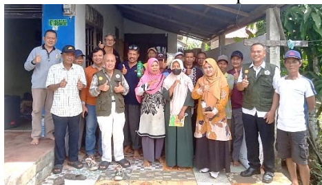
Gambar 4. Bersama Tim Fakultas Pertanian, Koordinator Penyuluh dan Kelompok Tani