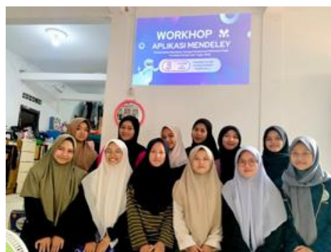
Gambar 3. Tim Pengabdian foto bersama Santri

Tim Pengabdian dan santri foto bersama. Pada pelatihan ini, santri sangat antusias dan memberikan respon yang positif.