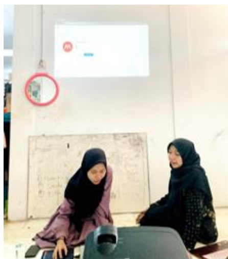
Gambar 4. Tim Pengabdian Memaparkan Materi

Kegiatan pelatihan dilaksanakan secara tatap muka di Pondok Pesantren Al Munawwir Putri Komplek L Krapyak Yogyakarta. Para santri yang mengikuti pelatihan adalah santri yang sedang berkuliah di Semester 1-6 dari berbagai institusi. Tim Pengabdian memaparkan materi pelatihan (bisa dilihat pada gambar 2) seperti pengenalan tentang Mendeley sebagai alat pengelola literatur, pemateri memaparkan secara langsung panduan instalasi Mendeley, cara mengoperasikan Aplikasi Mendeley dalam membuat daftar pustaka.