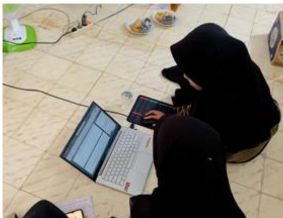
Gambar 3. Santri mempraktikkan penggunaan aplikasi dan di pantau oleh Tim

Santri satu persatu mempraktikkan cara menggunakan Aplikasi Mendeley yang sebelumnya sudah dipraktikkan oleh tim pengabdian. Santri mendownload salah satu jurnal online, kemudian menginput jurnal tersebut kedalam aplikasi, melengkapi data jurnal dan bagaimana memunculkan refrensi tersebut pada daftar pustaka.