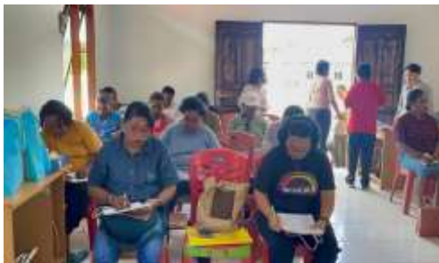
Gambar 1. Suasana Pelatihan: Peserta Fokus Mengerjakan Pre-Test

Foto ini memperlihatkan suasana awal kegiatan pelatihan, di mana para peserta UMKM dari Distrik Heram tengah serius mengerjakan soal pre-test. Kegiatan ini dilaksanakan sebagai langkah awal untuk mengetahui tingkat pemahaman peserta sebelum menerima materi pelatihan. Sebagian besar peserta terlihat tekun dan antusias, mencerminkan ketertarikan yang tinggi terhadap tema literasi keuangan yang dibawa dalam pelatihan ini.