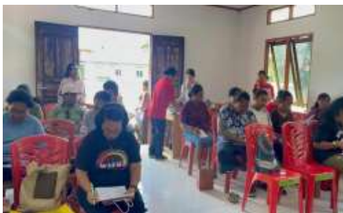
Gambar 2. Pendampingan Langsung Oleh Fasilitator

Pre-test terdiri dari 15 butir soal yang mencakup aspek pencatatan keuangan harian, pemisahan keuangan pribadi dan usaha, serta penyusunan laporan sederhana. Aktivitas ini memberikan gambaran dasar kemampuan awal peserta serta menjadi bahan evaluasi akhir saat post-test dilakukan. Ruang pelatihan yang sederhana namun kondusif menjadi bukti bahwa semangat belajar tidak terbatas pada fasilitas, melainkan pada motivasi dan kebutuhan akan ilmu praktis yang dibutuhkan dalam usaha sehari-hari.