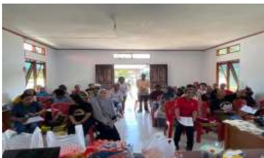
Gambar 3. Dokumentasi Bersama Peserta dan Tim Pelaksana

Pendampingan ini dilakukan secara berkala selama sesi praktik berlangsung, untuk memastikan semua peserta mendapatkan bantuan yang setara. Fokus pelatihan tidak hanya pada transfer pengetahuan, tetapi juga pada transformasi keterampilan melalui simulasi kasus nyata. Aktivitas ini sangat membantu peserta yang memiliki latar belakang pendidikan terbatas agar mampu mengikuti pelatihan secara aktif.