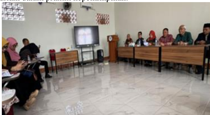
Gambar 2. Refleksi Bersama Kepala Madrasah dan Guru

Partisipasi aktif subyek dampingan dalam setiap proses menjadi kunci keberhasilan kegiatan ini. Pendekatan ABCD memungkinkan setiap individu merasa memiliki peran dan nilai dalam proses perubahan. Dalam sesi evaluasi akhir, para peserta memberikan respon positif dan mengusulkan keberlanjutan program dalam bentuk mentoring berkala. Kepala madrasah menyampaikan komitmennya untuk melanjutkan praktik-praktik kepemimpinan Islami yang telah dipelajari dalam kegiatan ini. Bahkan, madrasah merancang agenda tahunan untuk pelatihan manajerial internal dan penguatan nilai-nilai Islam dalam praktik kepemimpinan.