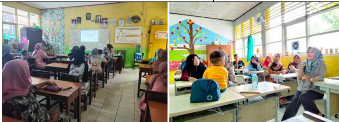
Gambar 1 & 2. Suasana pelatihan Parenting