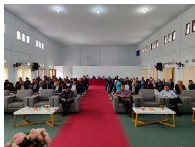
Gambar 1. Peserta Pelatihan Karya Ilmiah

Setelah penyampaian materi pertama, kegiatan dilanjutkan dengan Materi 2 yang membahas "Struktur Umum Karya Ilmiah", yang menjadi fondasi utama dalam proses penulisan ilmiah yang sistematis dan terstandar. Materi ini disampaikan dengan metode ceramah yang dipadukan dengan diskusi partisipatif, di mana peserta diajak mengidentifikasi bagian-bagian utama karya ilmiah, seperti judul, abstrak, pendahuluan, metode, hasil dan pembahasan, kesimpulan, serta daftar pustaka. Selain itu, fasilitator juga memberikan contoh konkret berbagai karya ilmiah dari jurnal nasional dan internasional untuk memudahkan pemahaman peserta terhadap struktur yang benar. Dalam sesi ini, peserta menunjukkan antusiasme yang tinggi dengan banyaknya pertanyaan yang diajukan terkait format penulisan, teknik sitasi, hingga pemilihan topik yang relevan. Materi ini memberikan landasan yang kuat bagi peserta untuk melanjutkan ke sesi berikutnya yang lebih aplikatif.