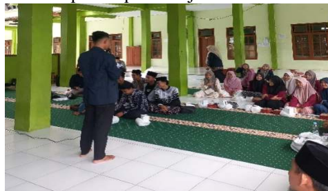
Gambar 4. Foto Kegiatan 4 (Evaluasi)

Tahapan selanjutnya adalah fase evaluasi dan perbaikan model. Evaluasi dilakukan untuk menilai efektivitas implementasi digitalisasi yang telah berjalan, mencakup kualitas pelatihan yang telah diberikan, keberfungsian alat yang digunakan, efisiensi alur kerja yang diatur dalam SOP, serta tingkat pemanfaatan kitab-kitab digital dalam proses pembelajaran sehari-hari di pesantren.