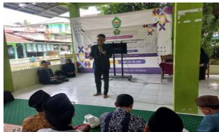
Gambar 1. Foto Kegiatan 1

Pengadaan alat dilakukan secara selektif sesuai dengan kemampuan lembaga, biasanya mencakup scanner, perangkat komputer/laptop, serta koneksi internet yang memadai. Karena keterbatasan dana dan sumber daya, pengadaan ini masih bersifat parsial dan belum mencakup seluruh kebutuhan ideal digitalisasi. Namun, fase ini penting sebagai fondasi awal agar proses digitalisasi dapat mulai dijalankan meskipun secara sederhana dan terbatas.