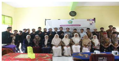
Gambar 3. Foto Bersama

Proses pembelajaran eksploratif di SMP Terpadu YPP Jamanis berlangsung dinamis melalui integrasi kegiatan di dalam dan di luar kelas. Di dalam kelas, guru menggunakan media visual seperti video dan gambar, serta cuplikan berita lingkungan untuk memantik diskusi. Materi seperti tauhid rububiyah, konsep khalifah, dan larangan fasād disampaikan secara aplikatif. Diskusi kelompok digunakan untuk mengaitkan materi dengan realitas lokal, seperti mengurangi plastik di sekolah dari perspektif ajaran Islam.