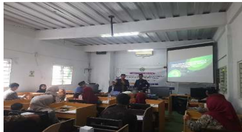
Gambar 2. Diskusi

Strategi dan teknik eksploratif yang diterapkan di SMP Terpadu YPP Jamanis mencerminkan upaya guru dalam mengaktifkan siswa melalui pengalaman langsung. Berdasarkan hasil wawancara dengan Ahmad Saefulloh, Nur Hidayati, dan Deni Supriadi, strategi yang digunakan meliputi observasi lapangan, diskusi kelompok, studi kasus, problem solving, serta teknik refleksi dialogis. Misalnya, siswa diajak mengamati pencemaran sungai, mendiskusikan praktik membuang sampah, serta merumuskan solusi berdasarkan nilai-nilai Islam.