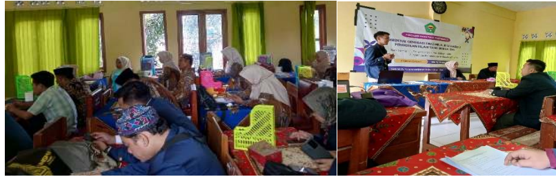
Gambar 1. Kegiatan Pembuatan RPP PAI

Strategi dan teknik eksploratif yang diterapkan di SMP Terpadu YPP Jamanis mencerminkan upaya guru dalam mengaktifkan siswa melalui pengalaman langsung. Berdasarkan hasil wawancara dengan Ahmad Saefulloh, Nur Hidayati, dan Deni Supriadi, strategi yang digunakan meliputi observasi lapangan, diskusi kelompok, studi kasus, problem solving, serta teknik refleksi dialogis. Misalnya, siswa diajak mengamati pencemaran sungai, mendiskusikan praktik membuang sampah, serta merumuskan solusi berdasarkan nilai-nilai Islam.