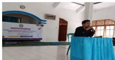
Gambar 1. Kegiatan Awal Pelatihan PKM

Salah satu bentuk utama penyemaian moderasi dilakukan melalui pengajian rutin yang mengangkat tema seputar toleransi, ukhuwah, dan hidup berdampingan dalam keberagaman. Dalam pelaksanaan pengajian bertema “Menjaga Kerukunan dalam Perbedaan” pada 30 Juni 2025, terlihat antusiasme jamaah yang mencapai lebih dari 60 peserta. Pemateri menggunakan pendekatan naratif, seperti kisah Nabi Muhammad SAW, untuk menyampaikan pesan-pesan damai. Kegiatan ini terbukti efektif dalam membumikan moderasi keagamaan secara emosional dan kultural. Hal ini juga menjadi media dakwah digital dengan adanya dokumentasi dan distribusi materi melalui media sosial komunitas.