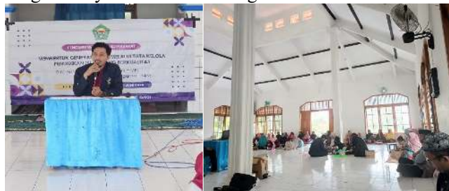
Gambar 3. Foto Kegiatan 3

Hasil Pengabdian yang dilakukan pada tanggal 29 Juni hingga 3 Juli 2025 mengungkap bahwa Majelis Taklim Babakan Jamanis memainkan peran multifungsi dan strategis dalam memperkuat sikap moderasi beragama di tengah masyarakat Desa Karangbenda.