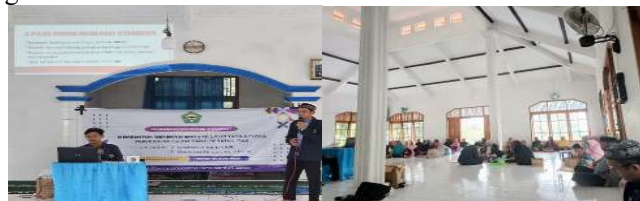
Gambar 2. Kegiatan Diskusi Pasca Pengajian oleh PKM

Setiap sesi pengajian dilanjutkan dengan forum diskusi terbuka. Salah satu diskusi pada 1 Juli 2025 membahas perbedaan mazhab dalam keluarga. Pendekatan tasamuh (toleransi) dan prinsip ikhtilaf sebagai rahmat disampaikan oleh narasumber, mendorong peserta untuk membentuk pola komunikasi yang terbuka dan sehat. Diskusi ini menciptakan ruang ekspresi yang bebas dari dogmatisme dan memperkuat nalar keagamaan kritis.