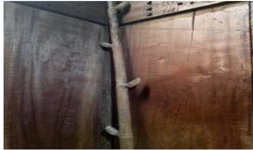
Gambar 7. Radi (Tangga)

setelah selesai makan dan sebelum keluar dari dalam rumah adat tersebut. Sapu yang di buat dari daun koli dan hanya bisa dilakukan oleh Perempuan yang berasal dari dalam rumah adat itu.)