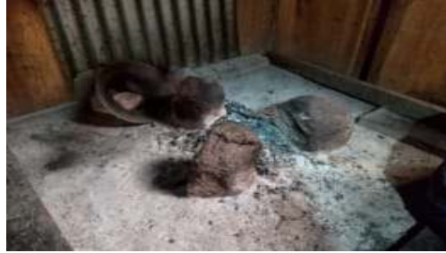
Gambar 3. Lika Pu'u (Tungku Api)

Dalam bahasa Bajawa Lika Pu'u memiliki fungsi pedhe maki fui Ale one sa'o saat acara adat. (Menandakan dasar pertama dalam rumah adat yang berfungsi untuk masak dalam acara adat.)