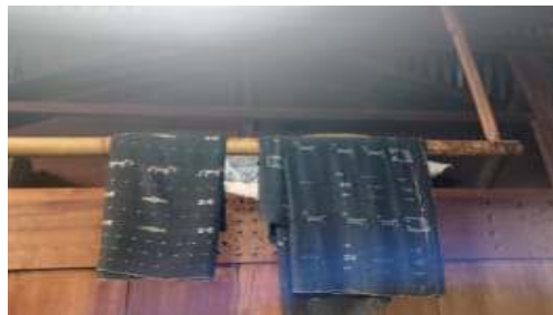
Gambar 11. Dao, Sapu ne Lawo (Tempat menyimpan kain dan juga pakaian adat serta menyimpan kain laki-laki dan kain perempuan)

Dalam bahasa Bajawa Kada Tempat untuk na'a Wati ne'e se'a, se'a wi pake untuk na'a tua saat acara adat untuk ganti gelas. (Kada yaitu tempat yang digunakan untuk menyimpan wati dan tempurung (tempurung sebagai pengganti gelas saat acara adat untuk menyimpan moke)