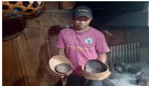
Gambar 4. Wati ne Sea (wati dan tempurung)

Dalam bahasa Bajawa Lika Pu'u memiliki fungsi pedhe maki fui Ale one sa'o saat acara adat. (Menandakan dasar pertama dalam rumah adat yang berfungsi untuk masak dalam acara adat.)