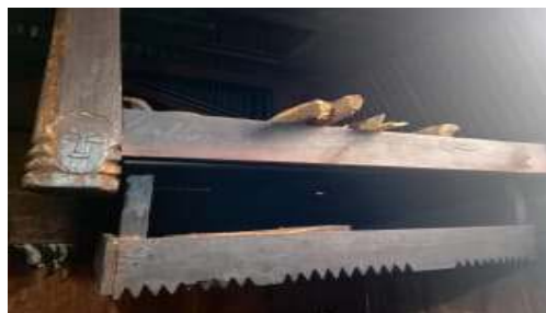
Gambar 5. Kogo Kae (Para-para)

Dalam Bahasa Bajawa Kogo Kae digunakan sebagai tempat wi na'a kaju d saat Ola uza atau hasil panen. ( kegunaanya untuk menyimpan kayu di saat musim hujan atau hasil panen.)