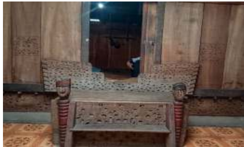
Gambar 2. KawaPere (Tangga sebelum masuk kedalam rumah adat )

Dalam bahasa Bajawa Watu Pali Wai uge ema zaman dulu biasanya seleza leza ata wi papa mu,a atau ne ata wi ingin lole ale one baru ata biasanya dhedha Wai ngia Watu pali Wai dau, jadi sei sei yang latu ale one baru akan to,a bahwa ne dhe ngodho tamu atau ata de lole melale one baru..( Orang tua jaman dulu biasanya setiap kali orang ingin bertamu atau seseorang ingin masuk ke dalam rumah orang biasanya kebas kami di watu Pali wai tersebut,jadi siapapun yang ada dalam rumah akan tau bahwa akan ada tamu atau seseorang akan masuk kedalam rumah)