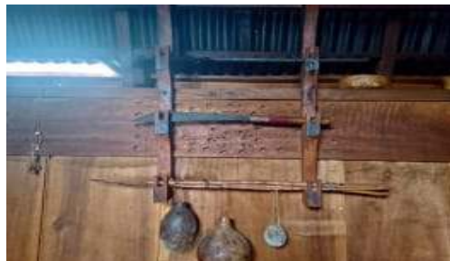
Gambar 9. Bhoka, Su'a, Sau, Gala ne Mata Raga (Tempat menyimpan moke, parang, Tombak)

Dalam bahasa Bajawa Dheke nia ga wktu karena nge weo dan bhai utuh, karena mali dhomi nia pu thelu dheke maka ngata nge weo atau bhai utuh. Thudi dhano tempat wi na, a nio yang kita guna ale one acara wi tau syukuran Oto zogo atau acara (kili Nio). (Tiang penyanggah terdiri atas empat karena bisa seimbang dan kokoh, karena jika hanya terdiri dari tiga tiang penyangka maka akan pincang atau tidak kokoh. Thudi juga tempat penyimpanan kelapa yang kita gunakan dalam acara untuk syukuran kendaraan baru atau acara ( kili nio )