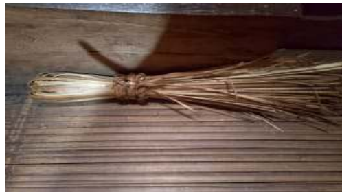
Gambar 6. Pui (Sapu)

Dalam Bahasa Bajawa Kogo Kae digunakan sebagai tempat wi na'a kaju d saat Ola uza atau hasil panen. ( kegunaanya untuk menyimpan kayu di saat musim hujan atau hasil panen.)