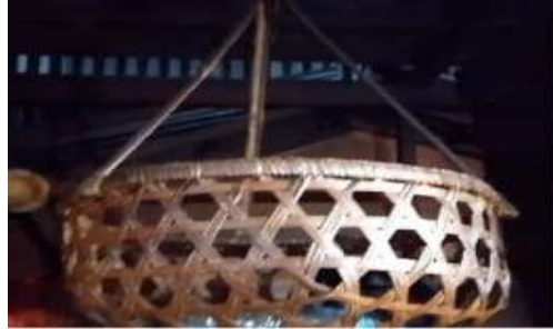
Gambar 10. Kada (Tempat untuk menyimpan wati dan tempurung)

Dalam bahasa Bajawa Kada Tempat untuk na'a Wati ne'e se'a, se'a wi pake untuk na'a tua saat acara adat untuk ganti gelas. (Kada yaitu tempat yang digunakan untuk menyimpan wati dan tempurung (tempurung sebagai pengganti gelas saat acara adat untuk menyimpan moke)