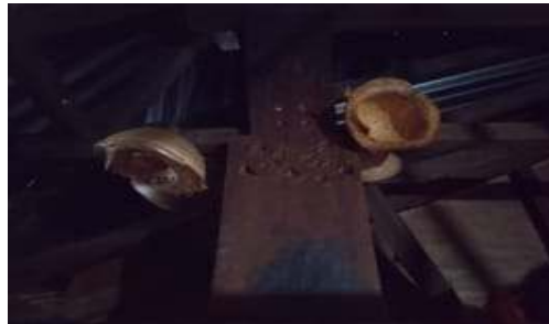
Gambar 8. Tudhi (Tiang penyangga)

Dalam bahasa Bajawa ebu nusi biasa pake dhke wi eki go ngani zeta Wawo bhila ngani pusaka Ale one sa'o. ( Biasa di gunakan untuk mengambilo barang di tempat tinggi untuik mengambi barang pusaka dalam rumah adat)