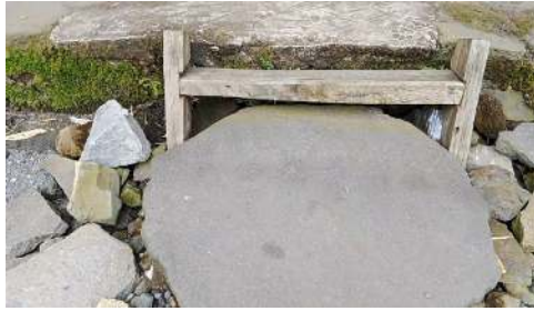
Gambar 1. Watu Pali Wai (Batu yang berukuran sedang yang digunakan oleh tamu untuk membersihkan kaki sebelum masuk kedalam rumah adat)

Dalam bahasa Bajawa Watu Pali Wai uge ema zaman dulu biasanya seleza leza ata wi papa mu,a atau ne ata wi ingin lole ale one baru ata biasanya dhedha Wai ngia Watu pali Wai dau, jadi sei sei yang latu ale one baru akan to,a bahwa ne dhe ngodho tamu atau ata de lole melale one baru..( Orang tua jaman dulu biasanya setiap kali orang ingin bertamu atau seseorang ingin masuk ke dalam rumah orang biasanya kebas kami di watu Pali wai tersebut,jadi siapapun yang ada dalam rumah akan tau bahwa akan ada tamu atau seseorang akan masuk kedalam rumah)